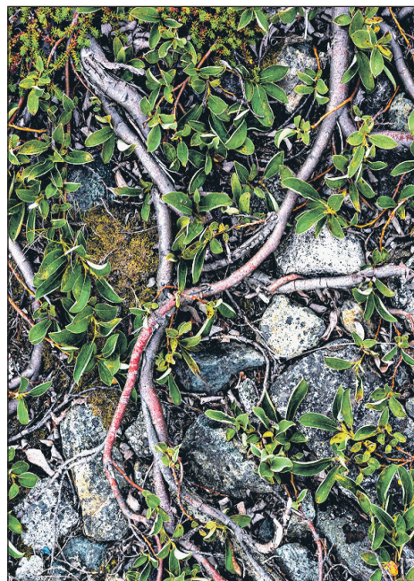
Это не сор. Это здешняя береза