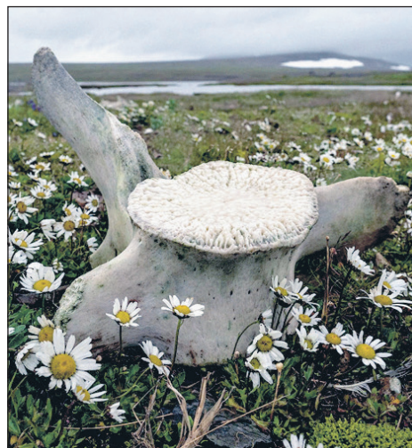
Позвоночник кита в ромашках