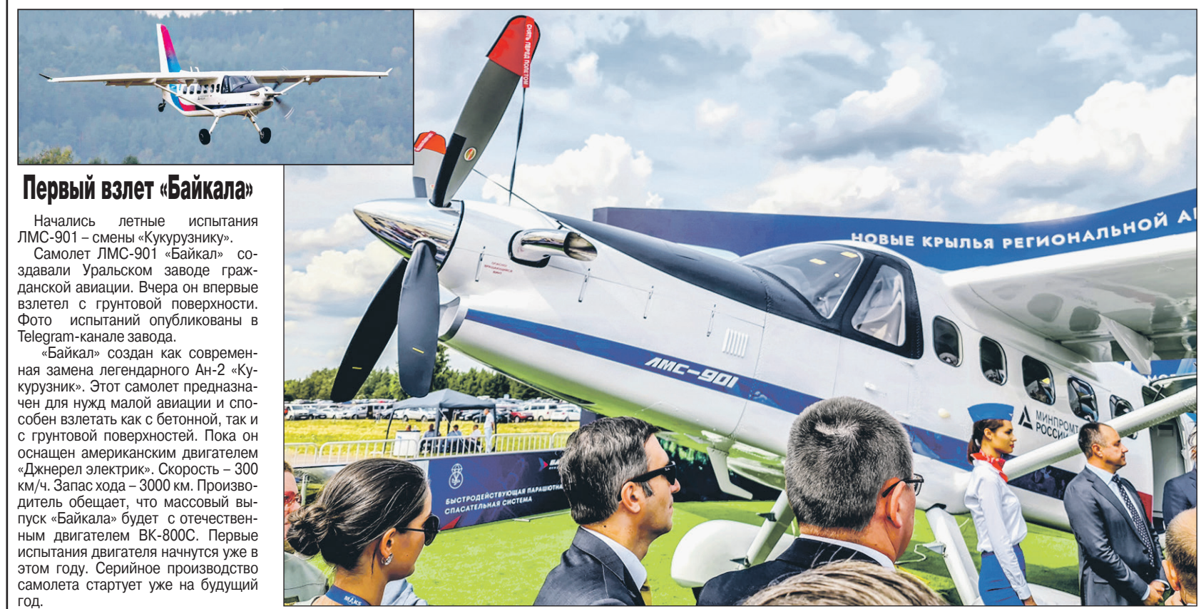
Первый взлет «Байкала»

Начались летные испытания ЛМС-901 — смена «Кукурузник». Самолет ЛМС-901 «Байкал» создавали Уральском заводе гражданской авиации. Вчера он впервые взлетел с грунтовой поверхности. Фото — испытание опубликовано в Telegram-канале завода.