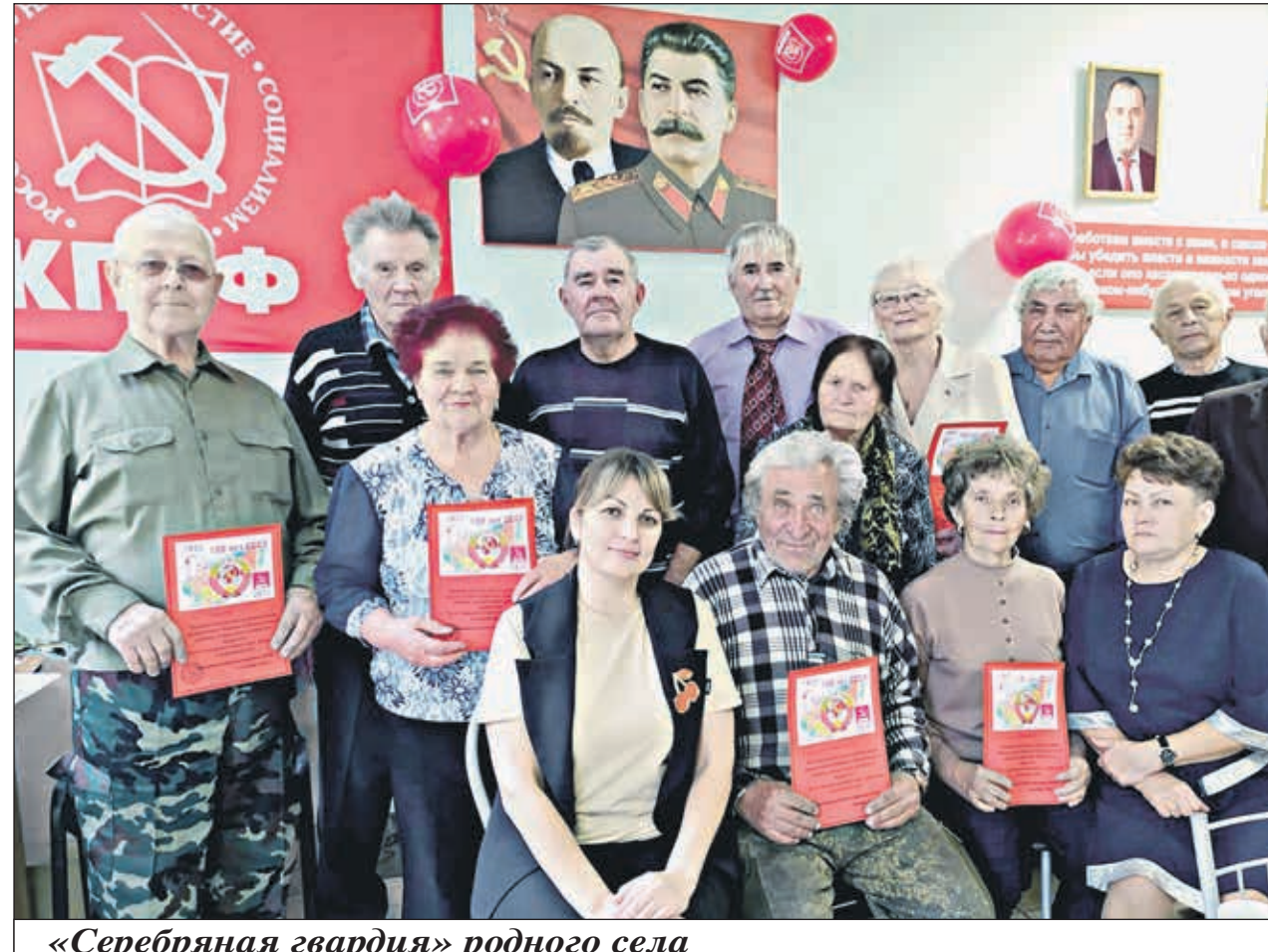
«Серебряная гвардия» родного села

А коммунисты с. Желалты вручили поздравления своим ветеранам на дому, а так же приняли участие в праздничном мероприятии в Доме культуры.