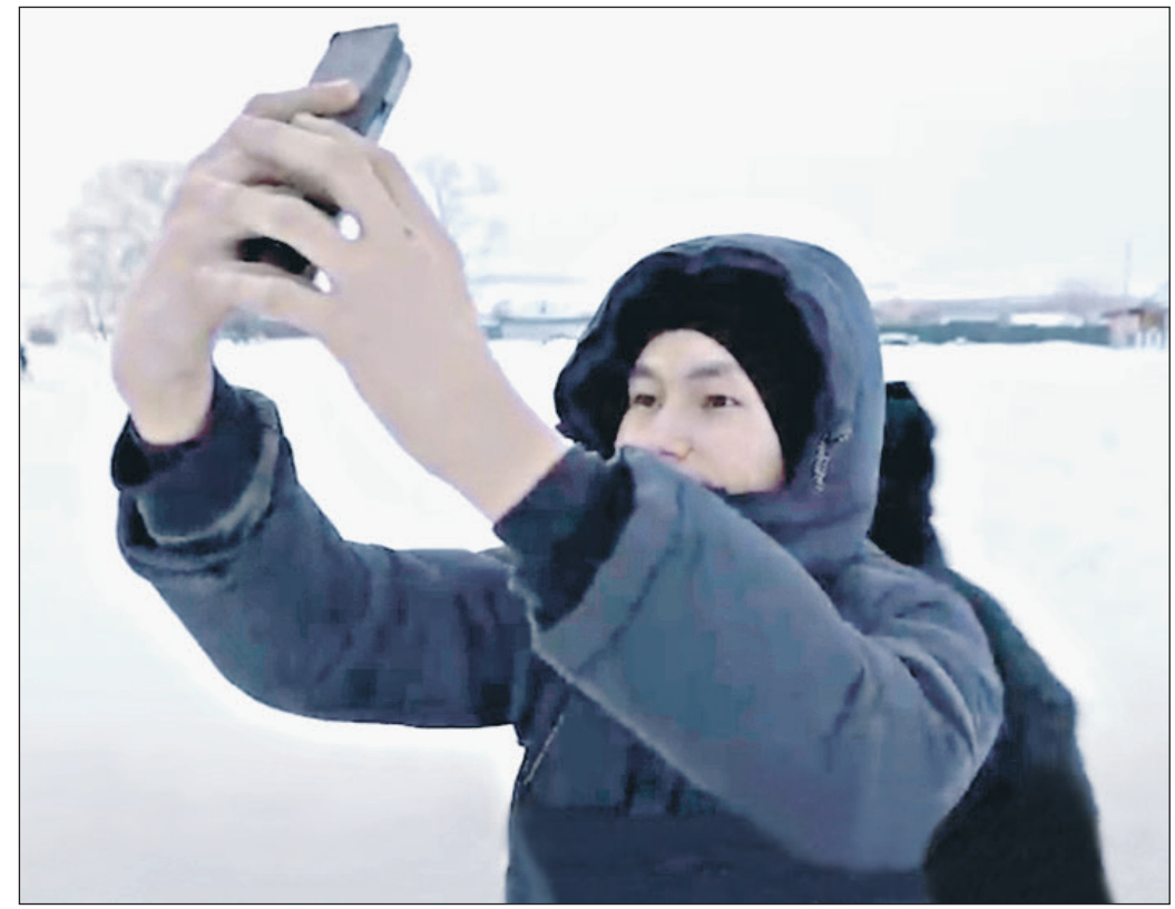
Видеоклип смотрите на нашем сайте sovross.ru

Как можно вести речь о каких-то деньгах, когда речь идет о здоровье детей целой деревни? Деревня Медяк — один из тысяч примеров в стране, где абсолютно идентичное положение с дистанционкой при отсутствии интернета. Власть всех уровней наглядно демонстрирует наплевательское отношение к людям. Ничего не слышно о какой-то обеспокоенности по этому поводу и родного Минобробразования.