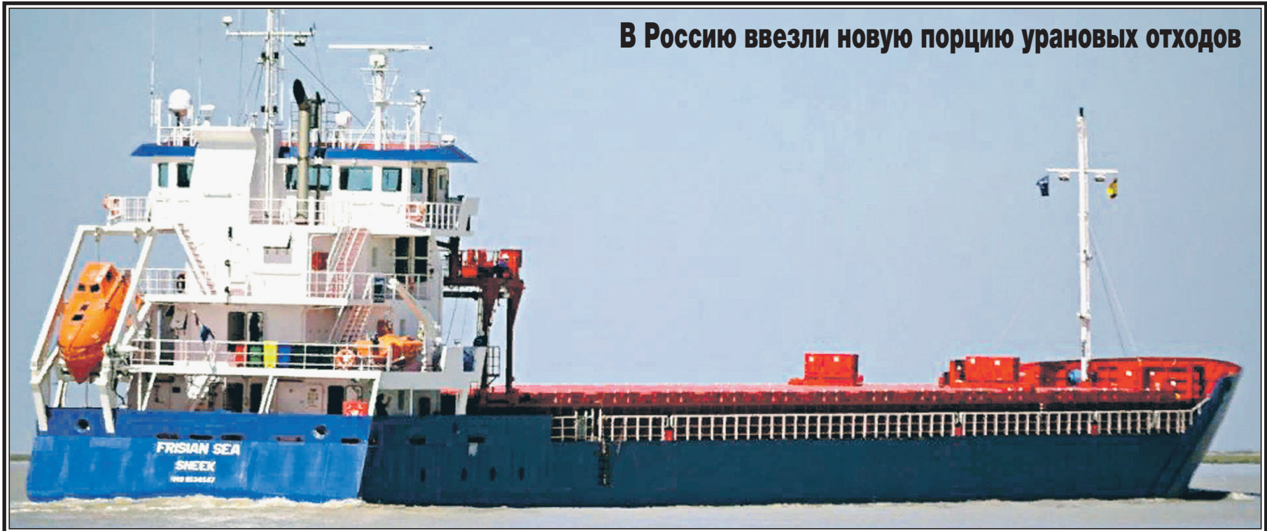
В Россию ввезли новую порцию урановых отходов