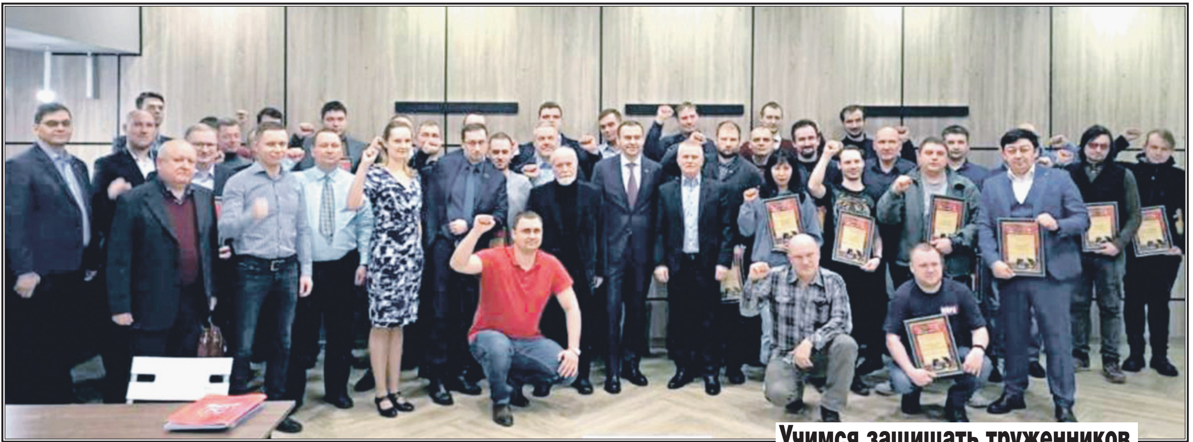
Учимся защищать труженников

Россия – крупнейший поставщик удобрений на мировых рынках наряду с Белоруссией, однако санкции уже негативно сказались на глобальных логистических цепочках.