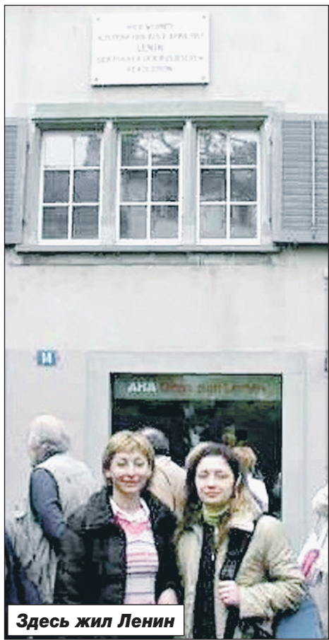
Здесь жил Ленин