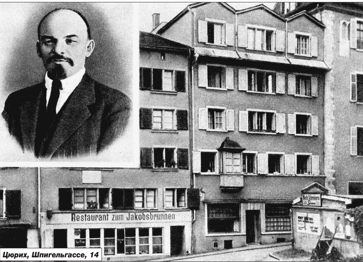
Цюрих, Шпигельгассе, 14