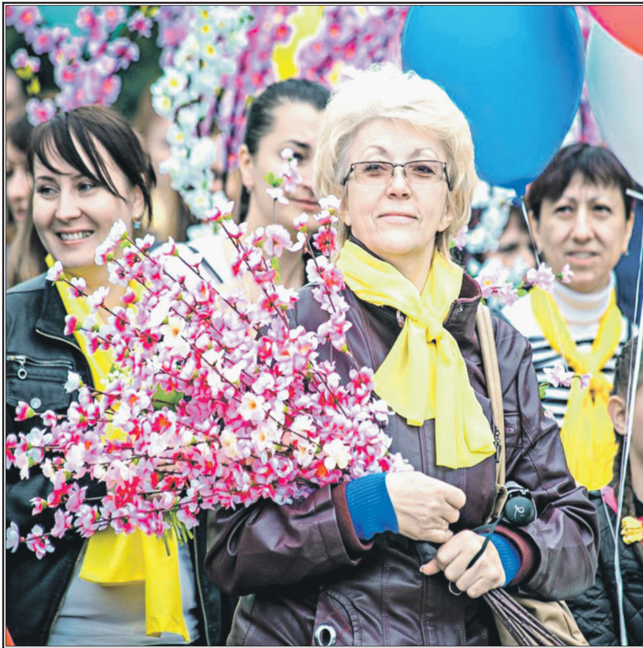
Г.А. ЗЮГАНОВ, Председатель ЦК КПРФ

Первого мая в Москве Центральный, Московский городской и Московский областной комитеты КПРФ, Ленинский комсомол и другие левые организации и движения проводят митинг, посвященный Дню международной солидарности трудящихся. Сбор участников: в 11.30 в сквере у памятника Карлу Марксу на Театральной площади (станции метро «Площадь Революции», «Театральная», «Охотный Ряд»).