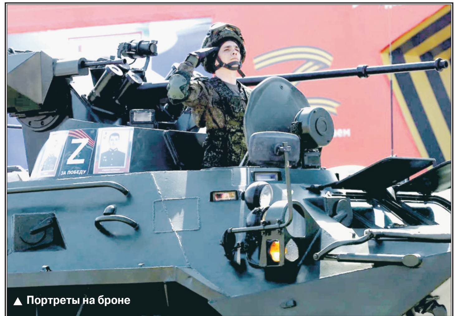
▲ Портреты на броне

Вслед за парадом на улицы и площади Москвы вышло более миллиона участников марша «Бессмертный полк». Всего в России в торжественной акции памяти приняли участие более 12 миллионов россиян.