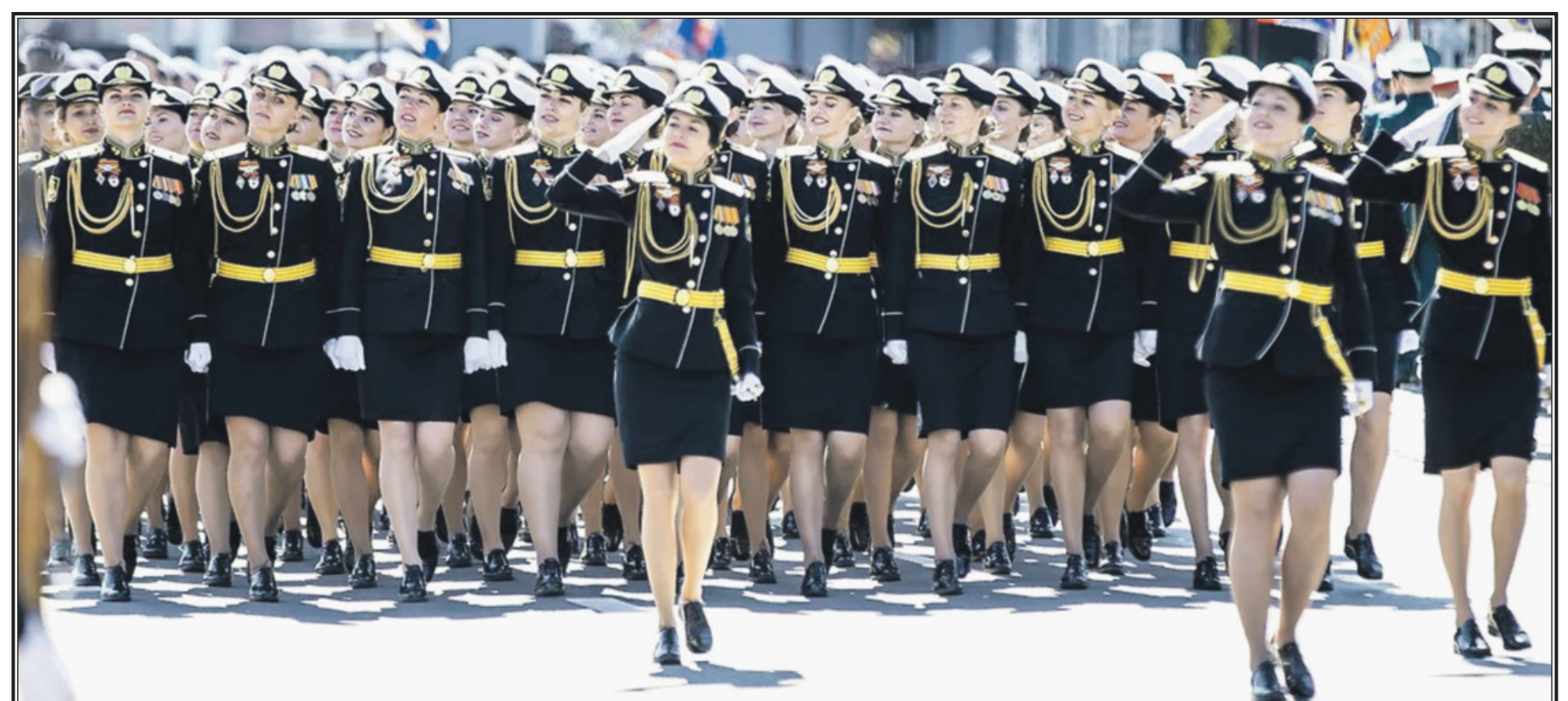
▼ Украшение Парада – крымчанки