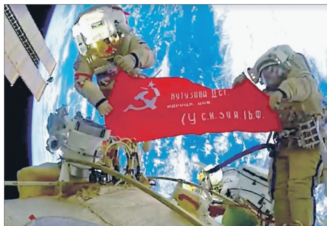
▲ Наш победный флаг на орбите

И кстати, впервые, более 260 тысяч человек посмотрели трансляцию парада Победы в Москве на 18,5 тысячах экранов в поездах в московском метро. Кроме того, после парада началась трансляция шествия «Бессмертный полк», а в 22.00 был показан салют.