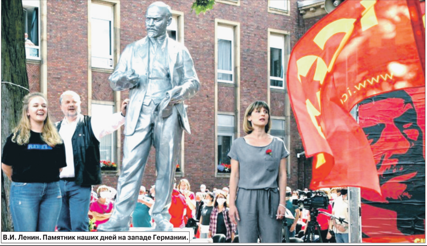
В.И. Ленин. Памятник наших дней на западе Германии.