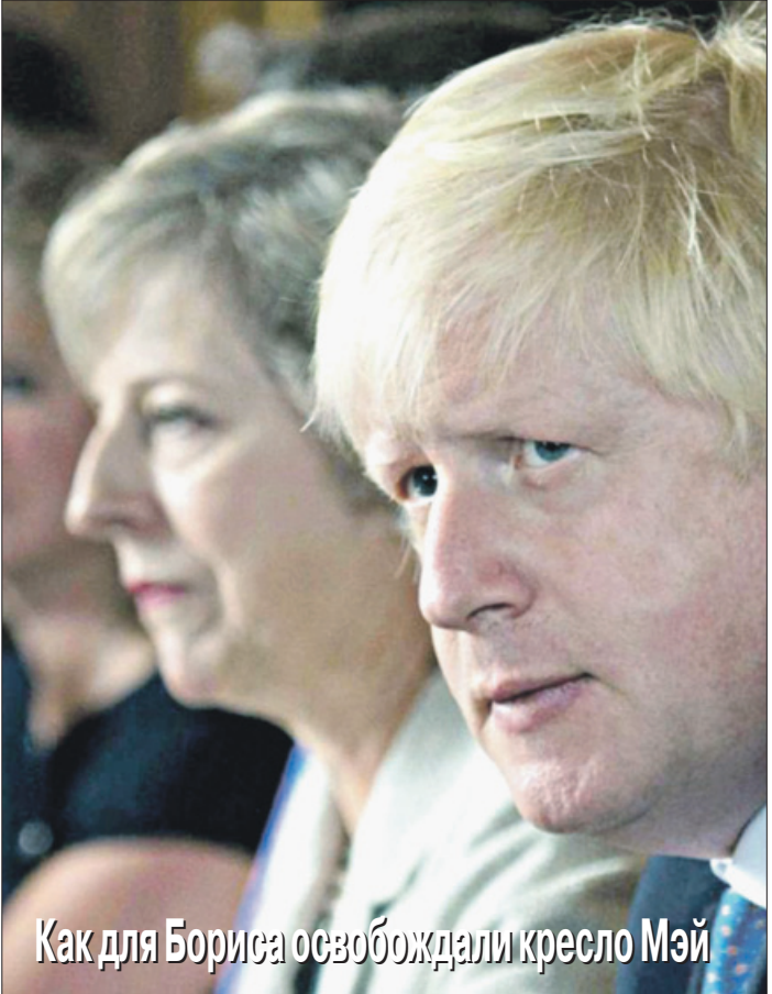
Как для Бориса освобождали кресло Мэй

В апреле 2019 года компания Crosby-Textor была разоблачена как скрытый ресурс, стоящий за серией фальшивых атакунтов в социальных сетях, нацеленных на миллио-