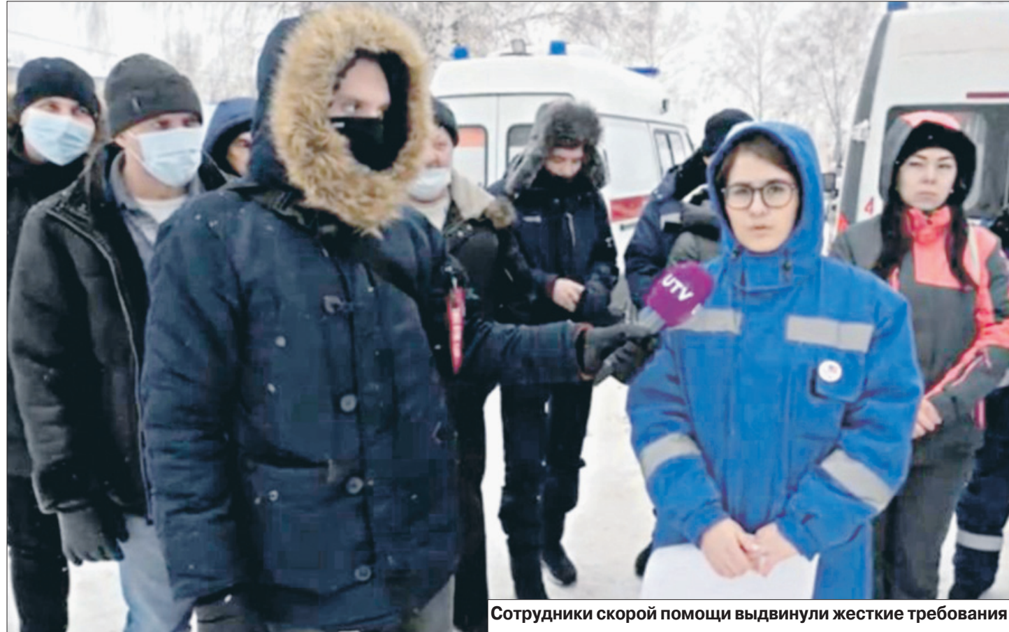
Сотрудники скорой помощи выдвинули жесткие требования