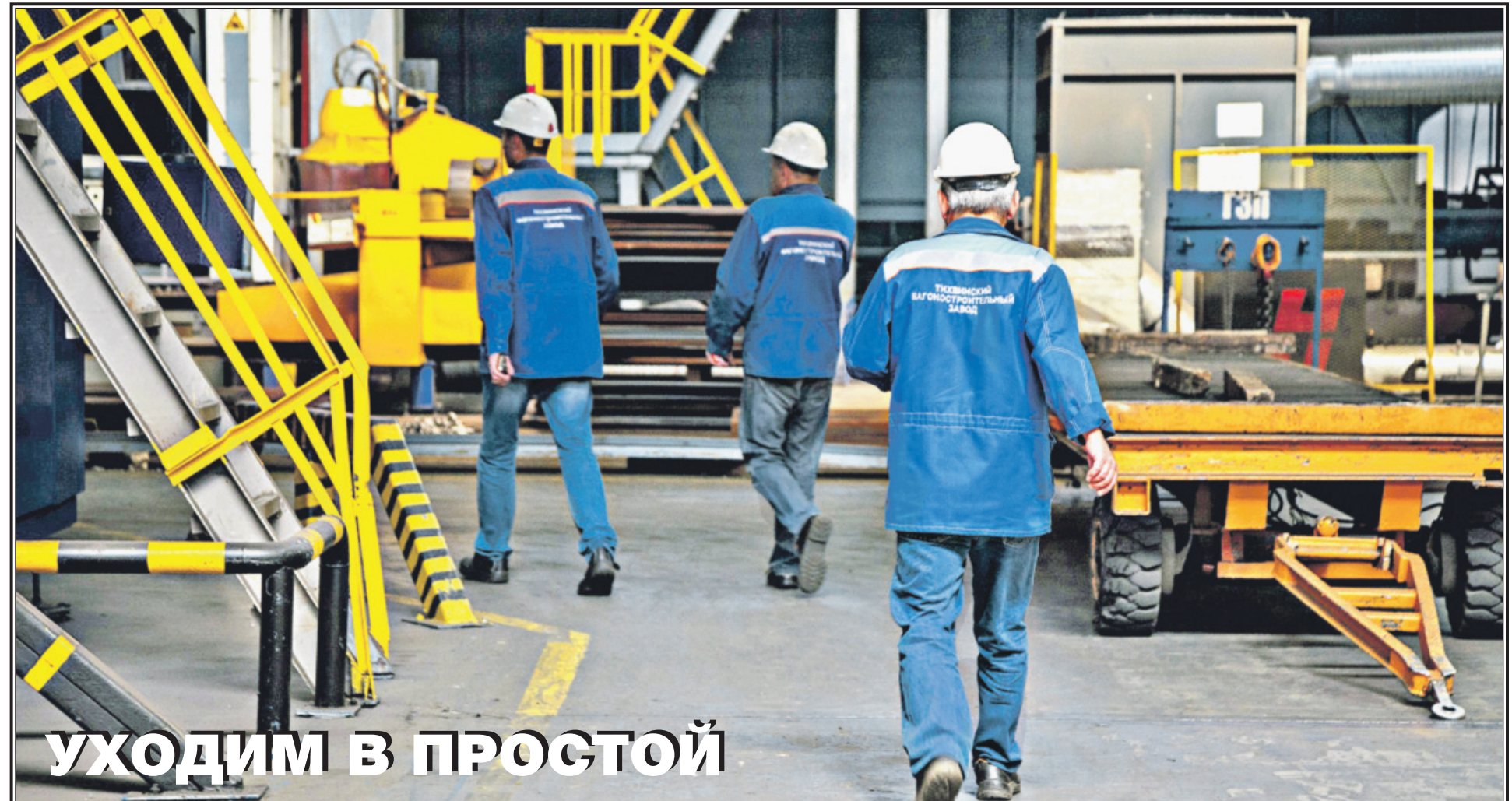
УХОДИМ В ПРОСТОЙ

увольнения более 9 000 человек в Калужской области», «Рабочие заблокировали базу «Гемонта» в Татарстане из-за долгов по зарплате». Таковы результаты рыночных экспериментов над российской экономикой и над российским населением.