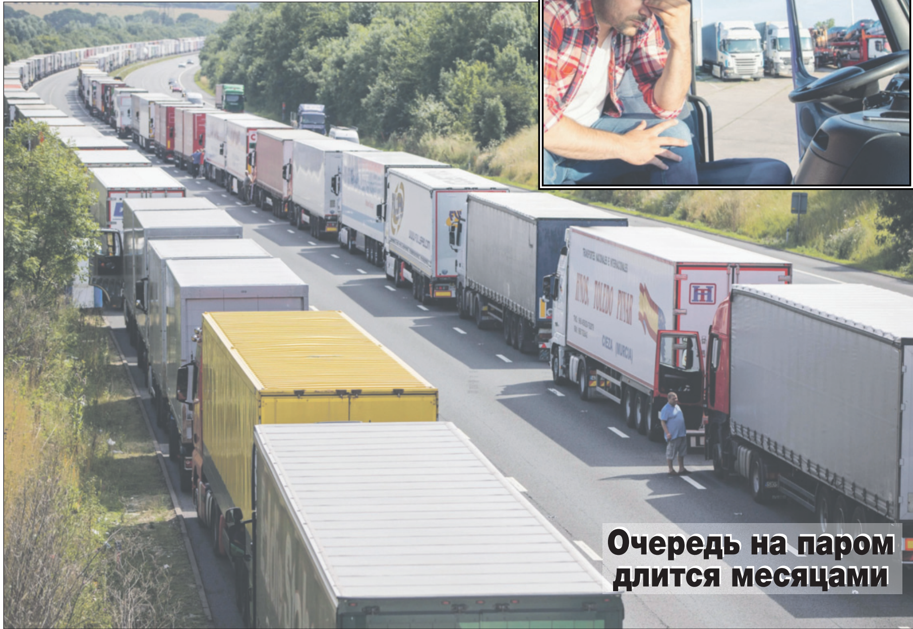
Очередь на паром длится месяцами