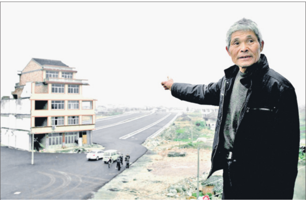
В Шанхае местные власти запланировали строительство большой дороги, но одна семья посчитала предложенную компенсацию ничтожной и съезжать отказалась. Дорогу всё же построили, а дом стоит прямо посередине.