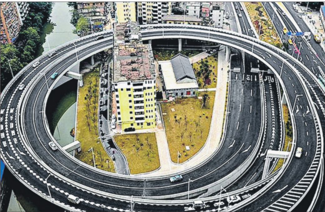
В Гуанчжоу правительство было вынуждено построить транспортное кольцо вокруг многоквартирного дома, потому что три семьи не захотели оттуда переезжать