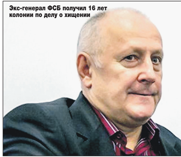
Экс-генерал ФСБ получил 16 лет колонии по делу о хищении