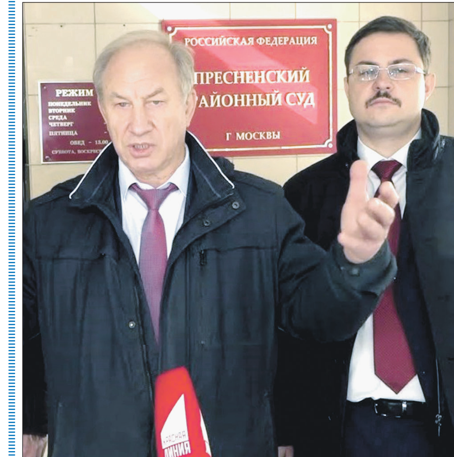
Видеолип смотрите на нашем сайте sovross.ru

...Более 130 тысячам москвичей не дали возможности проголосовать. Памфилова