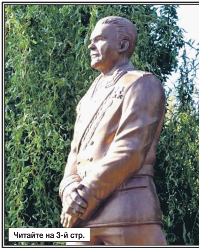
Читайте на 3-й стр.

В Словакии, в небольшом городке Старый Теков открыли памятник Маршалу Советского Союза, дважды Герою Советского Союза Родиону Яковлевичу Малиновскому. Монумент из бронзы создан словацким скульптором Славомиром Гибеем. Но, пожалуй, самое главное, что сделан он по инициативе и на средства местных жителей. В то время как в Прибалтике и ряде восточноевропейских стран памятники сносятся или уродуют, словаки бережно хранят историю братства с советским народом, принесшим освобождение от нацизма.