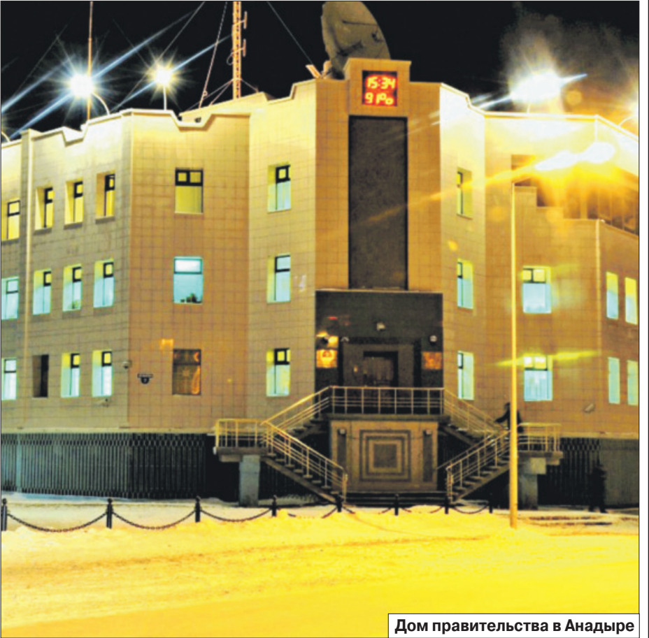
Дом правительства в Анадыре