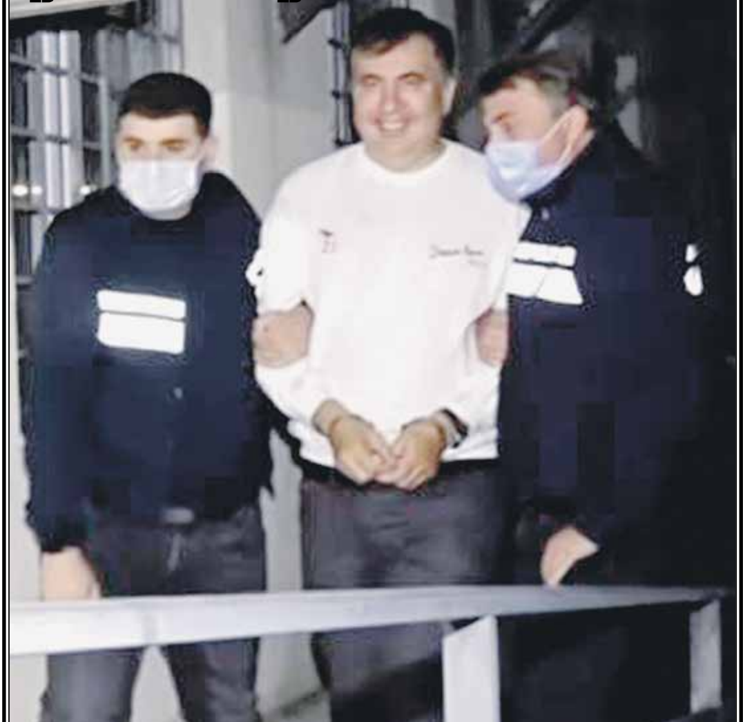
В Грузии сторонники экс-президента Саакашвили небольшими группами собираются у здания тюрьмы в Рустави в поддержку. Вчера полиция задержала участников акции, пытавшихся оставить на стене здания надпись «Свободу Мишел!».