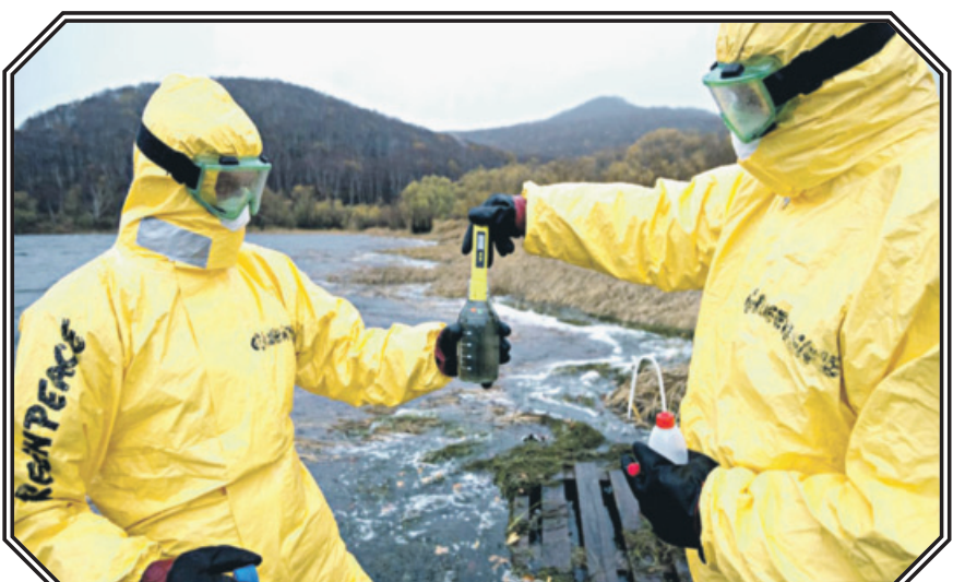
Происхождение токсинов, откуда они взялись?