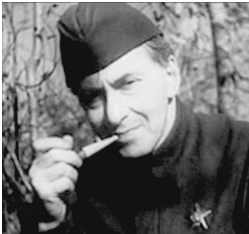
Илья ЭРЕНБУРГ (1891 — 1967)

Современный человек не меньше, чем зощенковский мужичик авиацией, напуган цифровизацией, потому что, с од-