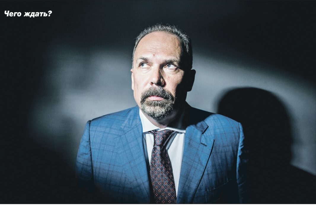
Михаилу Меню 60 лет. В ЖЧК с ноября он работает с июня 2018 года. До этого он был министром строительства и ЖКХ с мая 2013 года по май 2018 года, но не вошел в обновленный состав правительства после начала очередного президентского срока Владимира Путина. В июне президент предложил назначить его аудитором. Ивановской областью Мень руководил с декабря 2005 года по середину октября 2013 года.

«Что это за ерунда? В первый раз слышу. Я не в курсе, в чем дело, сейчас буду выяснять», – сказал Мень Интерфаксу и добавил, что находится в России.