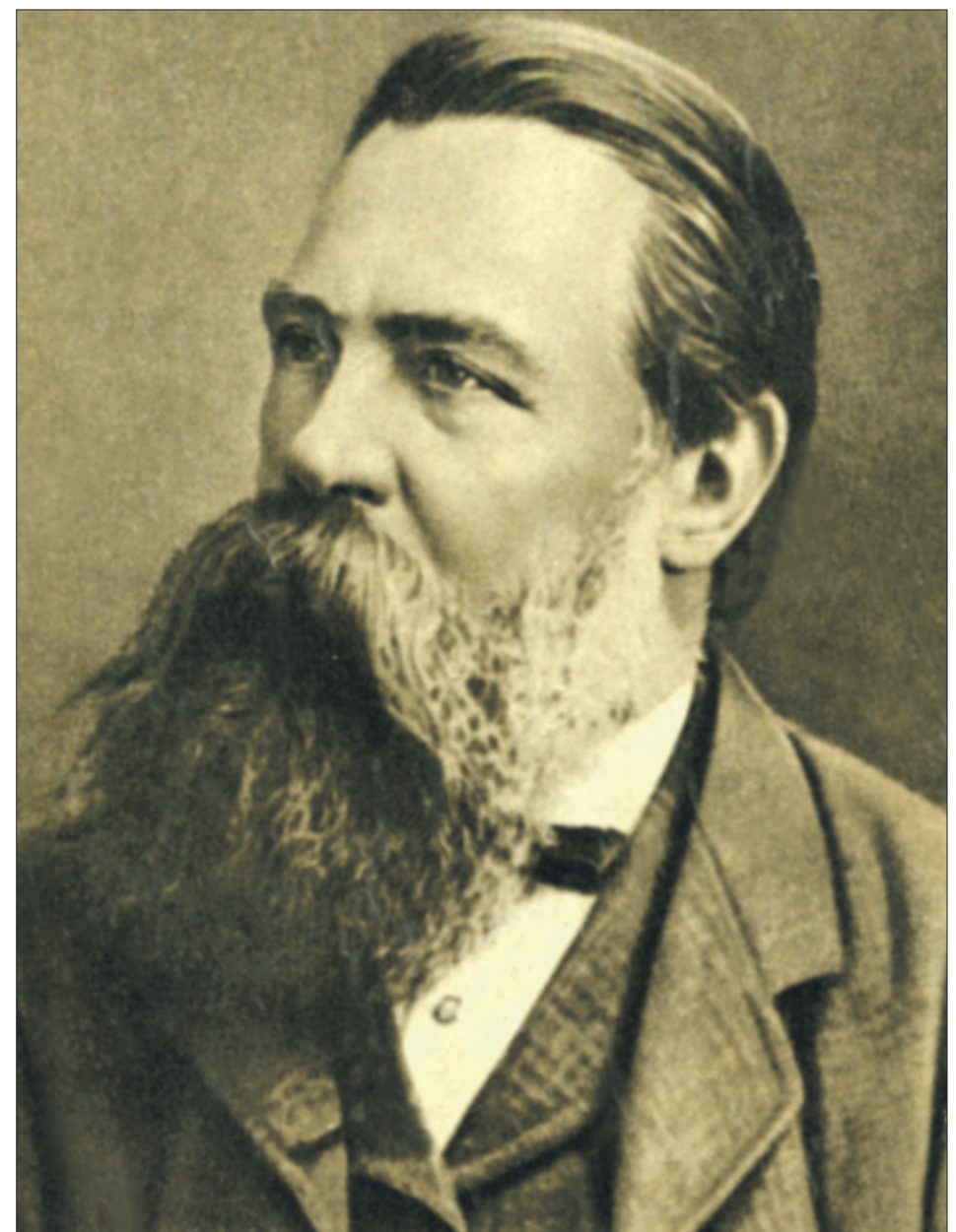
Имя и жизнь Энгельса должны быть знакомы каждому рабочему. В.И. Ленин

ЕЩЕ при жизни Фридриха Энгельса называли «человеком-титаном», «человеком-магнитом». Природа щедро наделила его лучшими качествами и в духовном, и в физическом отношении. Энгельс рос в противоборстве со всем, что его окружало, подобно героям мифов, былин и сказаний. В непрерывном сопротивлении мертвящей лютеранской догме, лицемерному служению прусскому королю и коммерции, в буре дум и мечтаний окрепла его воля. Играя на клавишине или листая книги, он уносился в поднебесье или окунался в кратеры вулканов, мысли забрасывали его в безбрежное прошлое и будущее человечества.