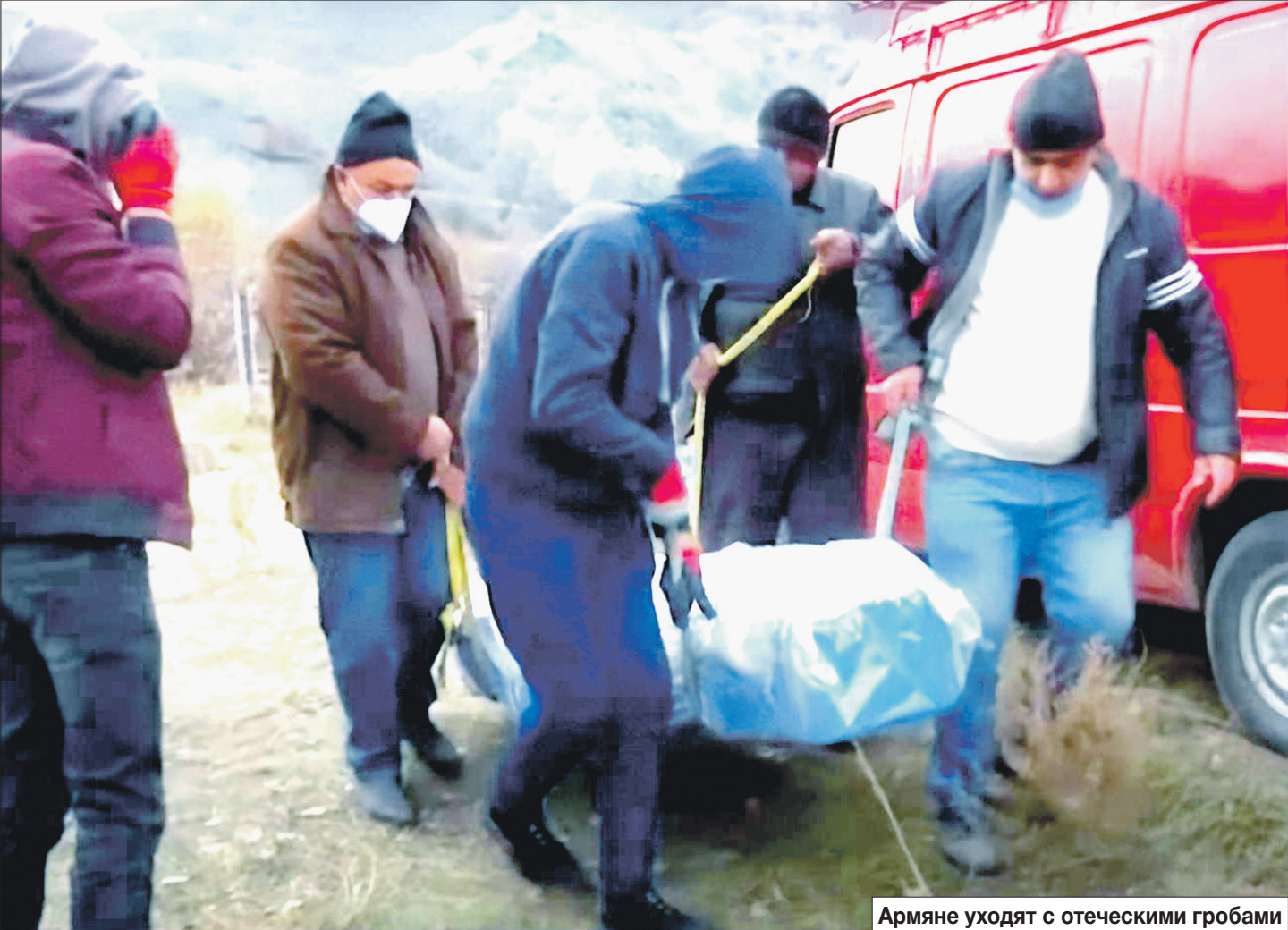
Армяне уходят с отеческими гробами

Вечером один из наших нагруженные скарбом грузовики выезжают из опустевшего города Кельбаджара. Полицейские из