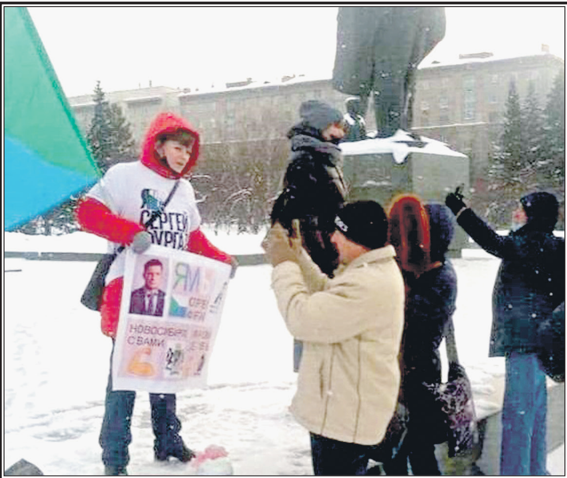
Акции протеста против измененной федеральными властями Конституции прошли в нескольких городах Сибири.

В Новосибирске их совместили с поддержкой протестующих хабаровчан. Несколько человек встали с одиночными пикетами на площади Ленина, к ним присоединились противники изменения конституции.