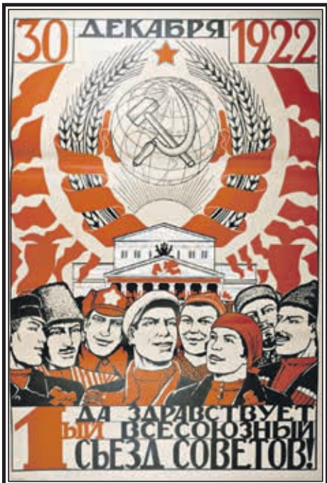
Плакат, выпущенный накануне Первого всесоюзного съезда Советов

1922 год. Сталин – Генеральный секретарь ЦК РКП