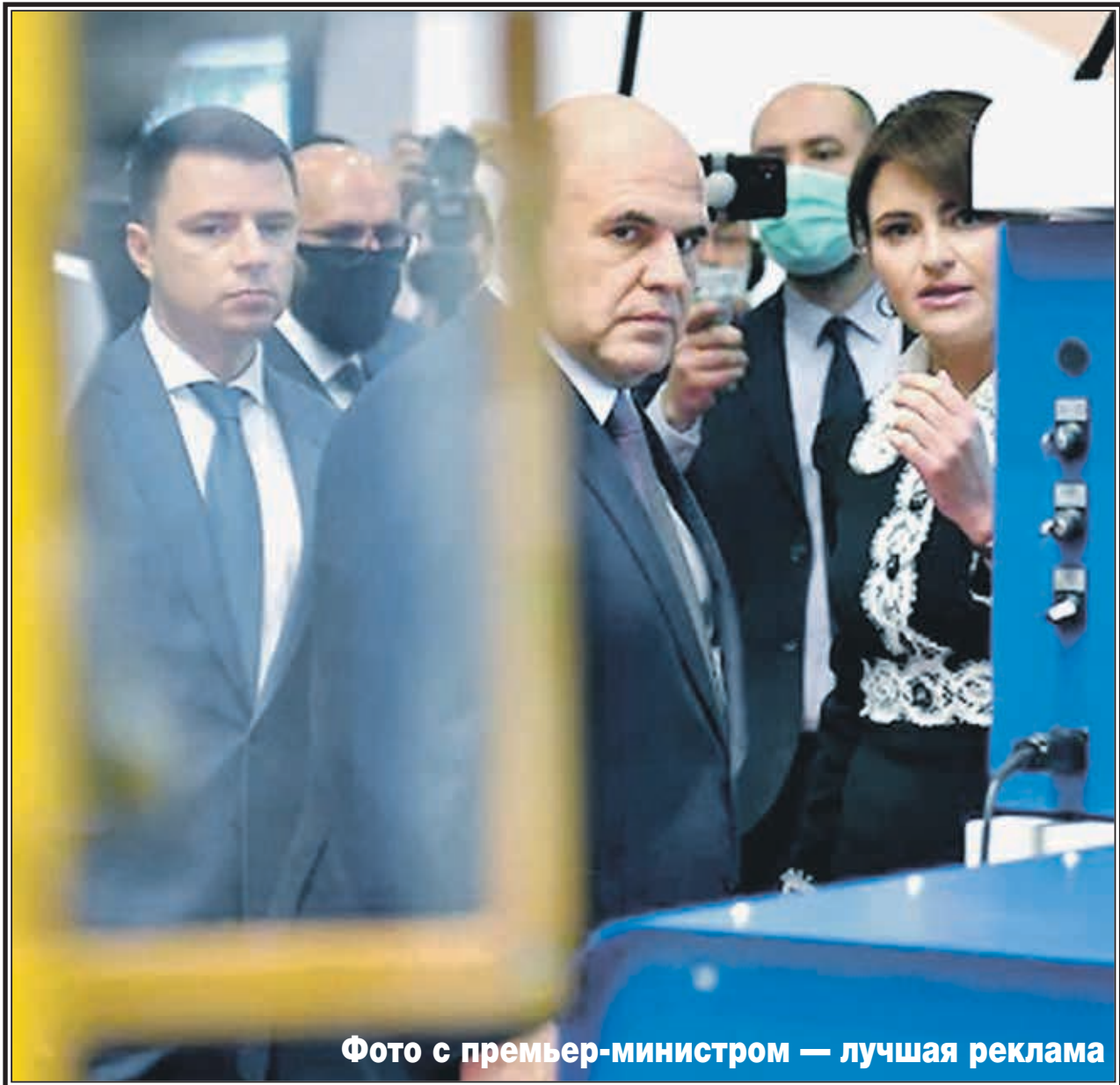
Фото с премьер-министром — лучшая реклама

Друзья, надо объяснять людям, что это делается в интересах вражеского класса, в интересах сверхбогатых людей, и мы ни в коем случае не должны это воспринимать за чистую монету. Мы видим реальную картину за нашими окнами, видим то, что они творят с нашей страной, с нашими городами и регионами, с каждой семьей, с каждым гражданином. Распространяйте информацию в социальных сетях и мессенджерах, боритесь за сознание людей. Боритесь за свои права!