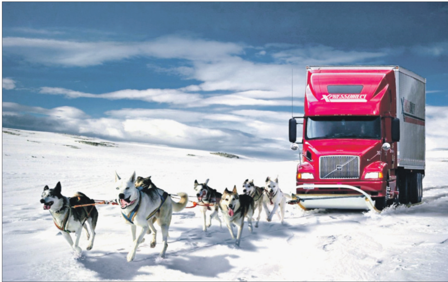
Самые бесполезные новогодние подарки