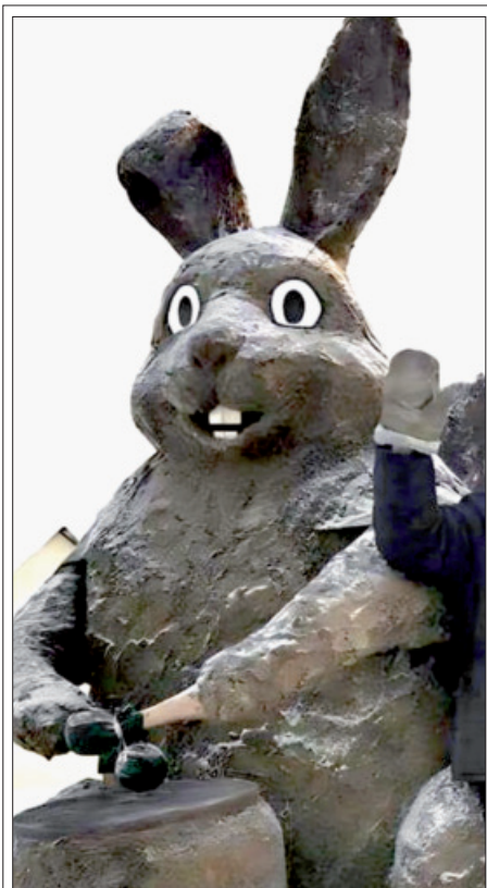
Якутия. Навозный зайчик к Новому году