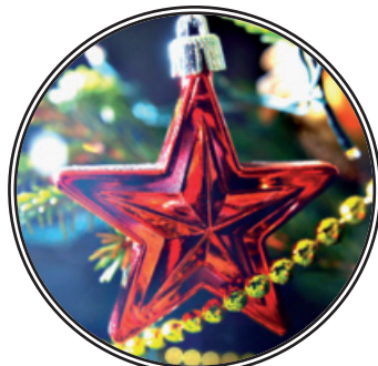
Новый год – дома

Н.В. АРЕФЬЕВ, первый зампредседателя Комитета ГД по экономической политике, секретарь ЦК КПРФ