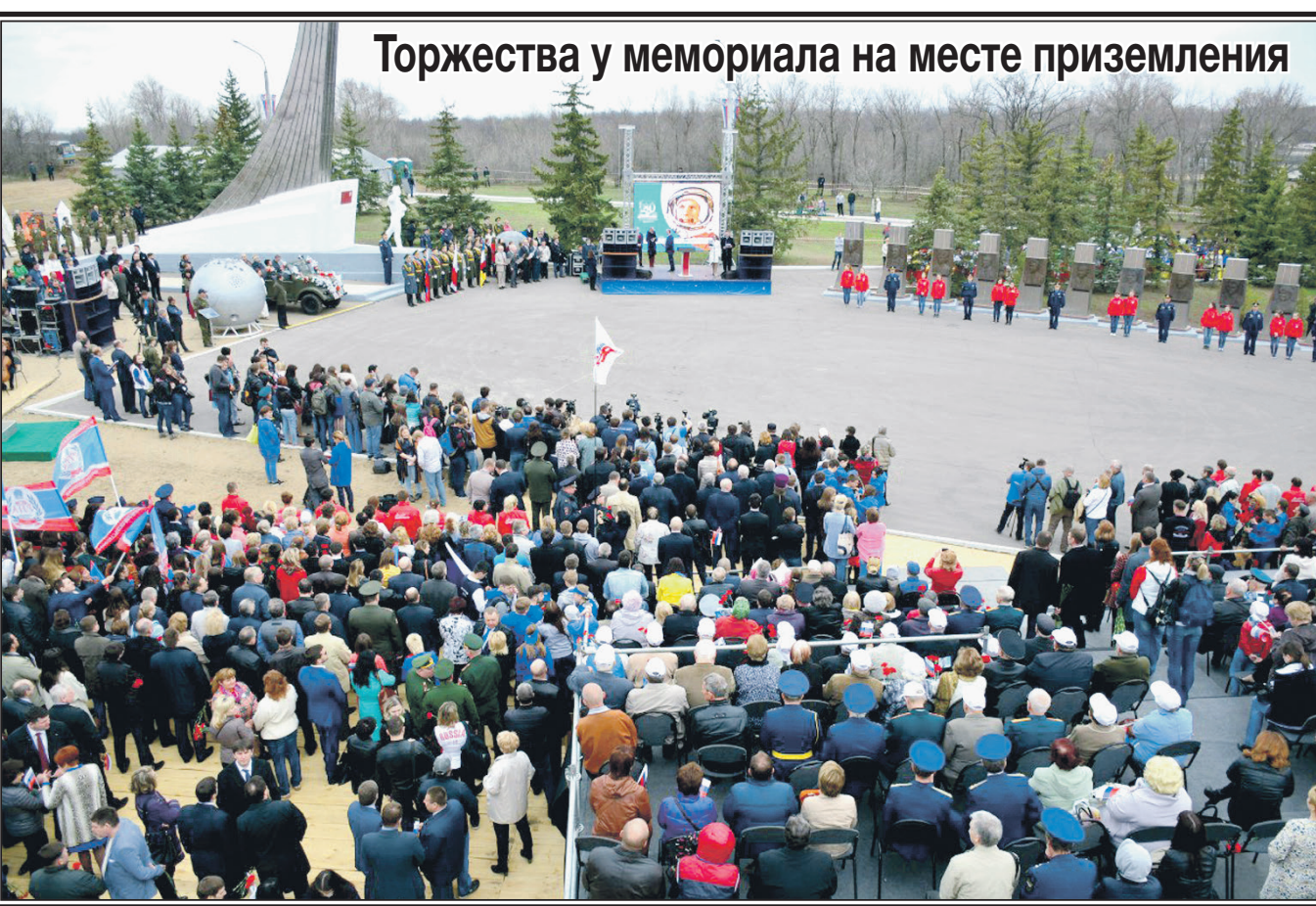
Торжества у мемориала на месте приземления