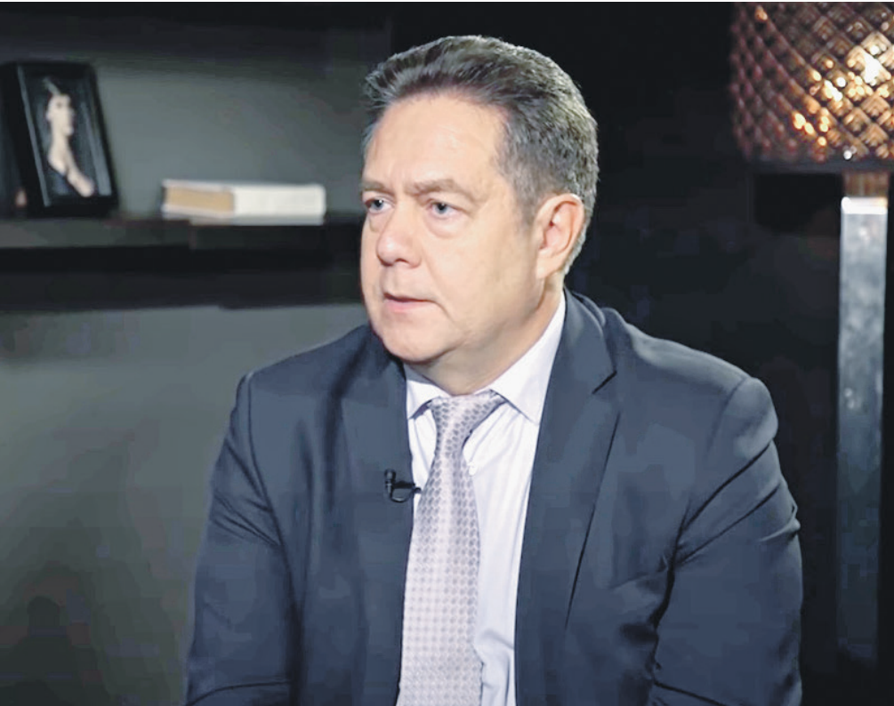
Сайт sovross.ru воспроизводит интервью полностью.

емость была тогда высокая. Главное, у нас, знаете, почему еще население-то убавляется? Не только потому, что у нас рождаемость низкая. У нас смертность высокая! Мы на 112-м месте в мире по продолжительности жизни. В Европе хуже нас только Украина. Во всех странах Европы живут дольше! У нас президент хвалится средней продолжительностью жизни 73 года. Во Франции – 84. Там везде за 80! При одинаковой рождаемости, если смертность меньше, население не убавляется. У них же оно не убавляется, у них оно растет. Медленно, но растет. У нас же проблема, что мы с вами вымираем потому, что низкая продолжительность жизни именно у мужчин. И именно поэтому введенная властью пенсионная реформа – свинская, потому что при средней продолжительности жизни в Тамбове у мужчин 65 лет получается, он, что ни одного дня на пенсии не будет жить? В Германии пенсионный возраст 67 лет, но там живут 84 года. Соответственно, на пенсии человек в среднем живет 15–16 лет. У нас, по логике, тогда пенсионный возраст должен быть 50 лет у мужчин.