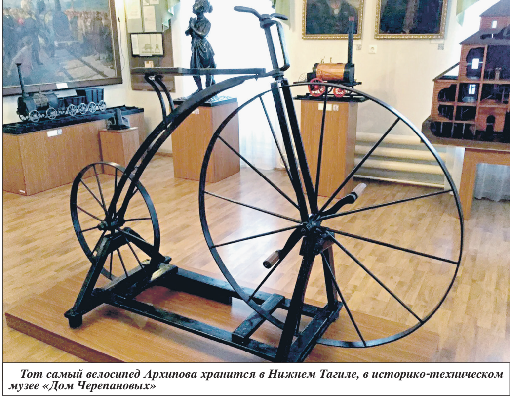
Тот самый велосипед Архипова хранится в Нижнем Тагиле, в историко-техническом музее «Дом Черепановых»

«Советская Россия» открывает новую рубрику «Первые» и приглашает читателей принять в ней участие. Если вам известны об изобретениях, фактах, событиях, в которых русские люди стали первооткрывателями, первопроходцами, и имеются аргументы, подтверждающие это, пишите. Газета с удовольствием опубликует ваши письма и рассказы. России есть чем гордиться и что поставить нашему народу в заслугу.