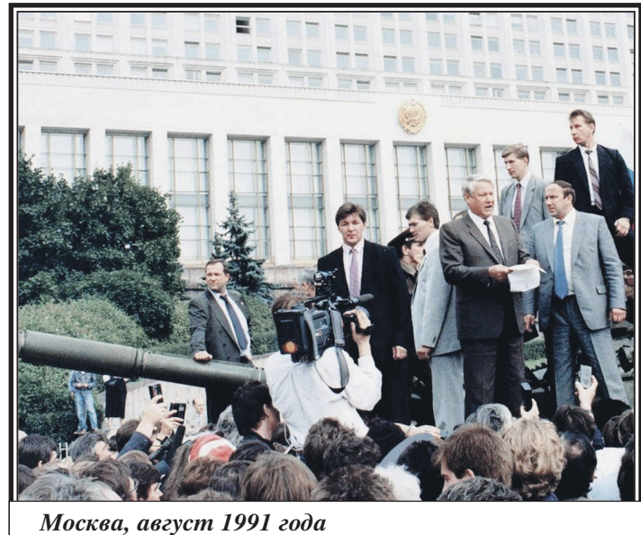
Москва, август 1991 года