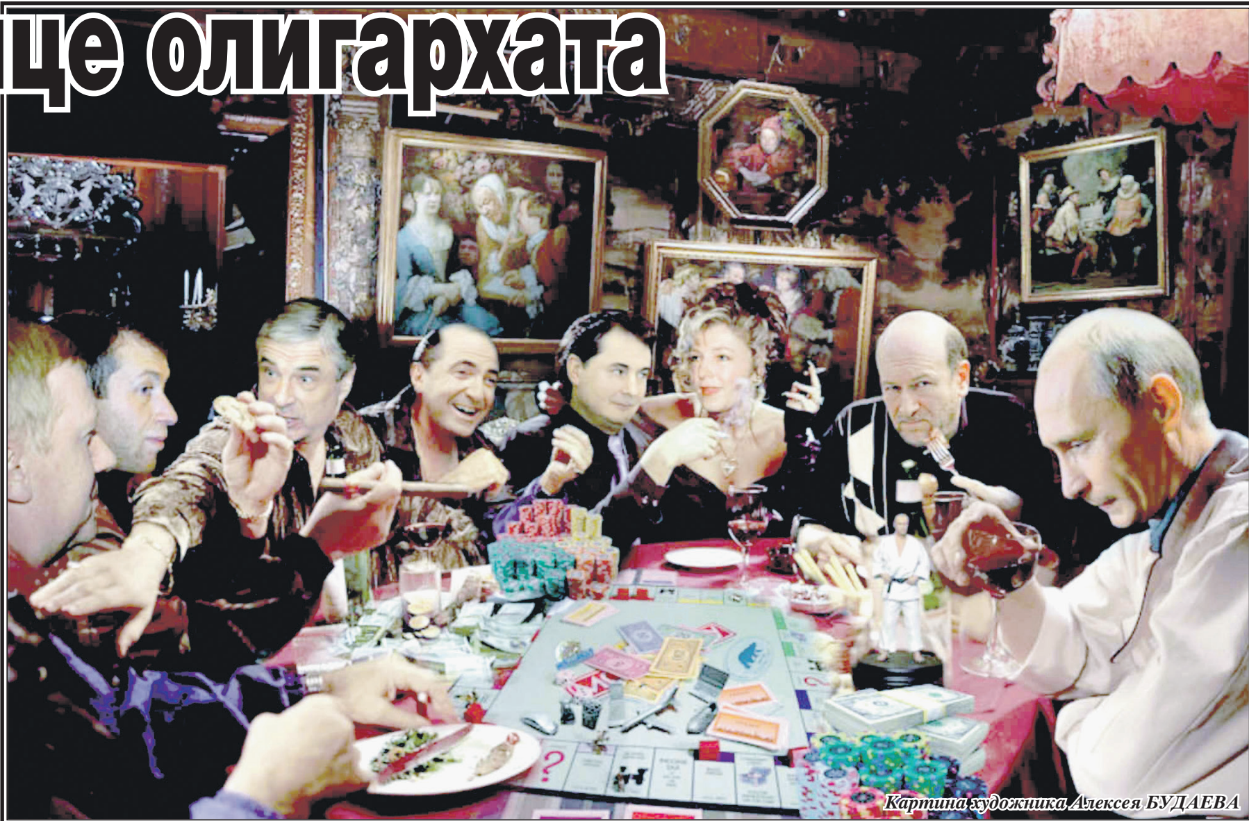
Картина художника Алексея БУДАЕВА

(Подсчеты аналитиков Boston Consulting Group)