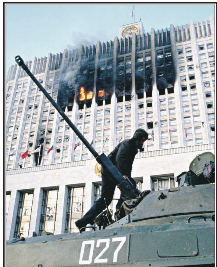
Расстрел парламента в 1993 году