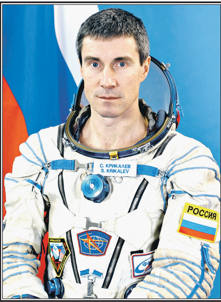
С. КРИКАЛЕВ S. KRIBALEV

«Съемки фильма на МКС собираются вести в рамках так называемого научного эксперимента «Вызов». Под этим бюрократическим прикрытием была сломана программа космических полетов 2021 года. Программа научных экспериментов формируется не вдруг, довольно долго. По старой программе на борту было три человека. Из-за этого эксперимента мы выбросили треть рабочего времени – теперь на борту планируются два человека в течение года», – поясняет Юрчихин.