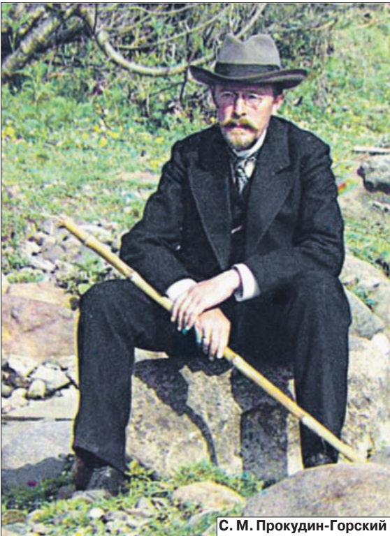
С. М. Прокудин-Горский

На сегодняшний день сохранилось более тысячи фотографий Прокудина-Горского в разных музеях и библиотеках России и мира. Это уникальные позитивно-эмоционально окрашенные виды природы средней полосы, древние церкви, крестьяне и их быт, простые лица рабочих, инженеры на строительстве плотин, даже Средняя Азия – вся дореволюционная Россия в красках. В 1898 году Прокудин-Горский опубликовал первые кни-