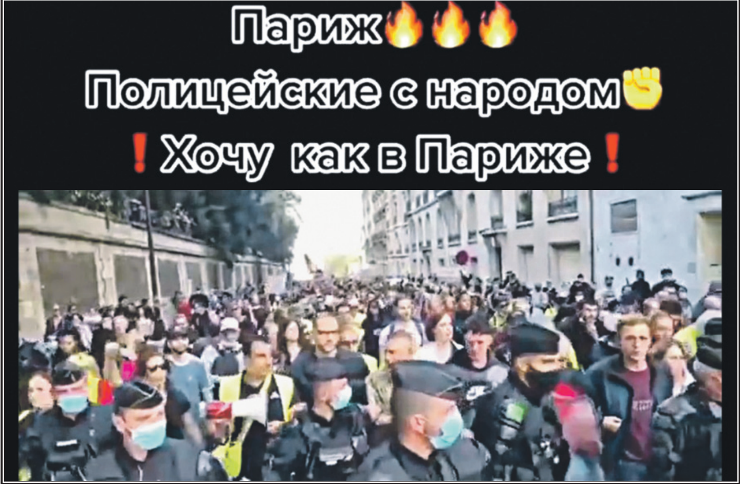
Респект, настоящие мужчины в форме, защитники закона и порядка, народные герои. Не то что наши...