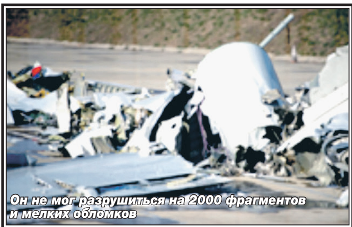
Он не мог разрушиться на 2000 фрагментов и мелких обломков

Левый двигатель нашли без существенных деформаций. Позднее нашли правый, у которого половина лопаток турбины оказалась срезанной. Такой характер повреждений опровергает версию попадания в двигатель птицы. Скорее всего, в него залетели металлические части разорванной обшивки, расположенной впереди двигателя.