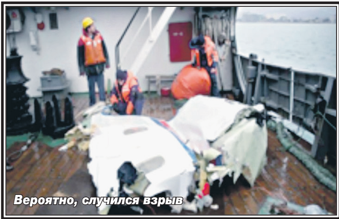
Вероятно, случился взрыв

автоматически корректируется. Об этом свидетельствует и текст переговоров экипажа: