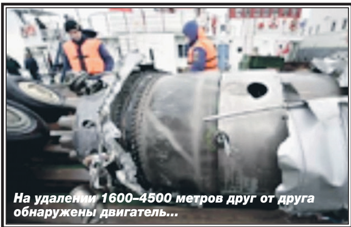
На удалении 1600–4500 метров друг от друга обнаружены двигатель...