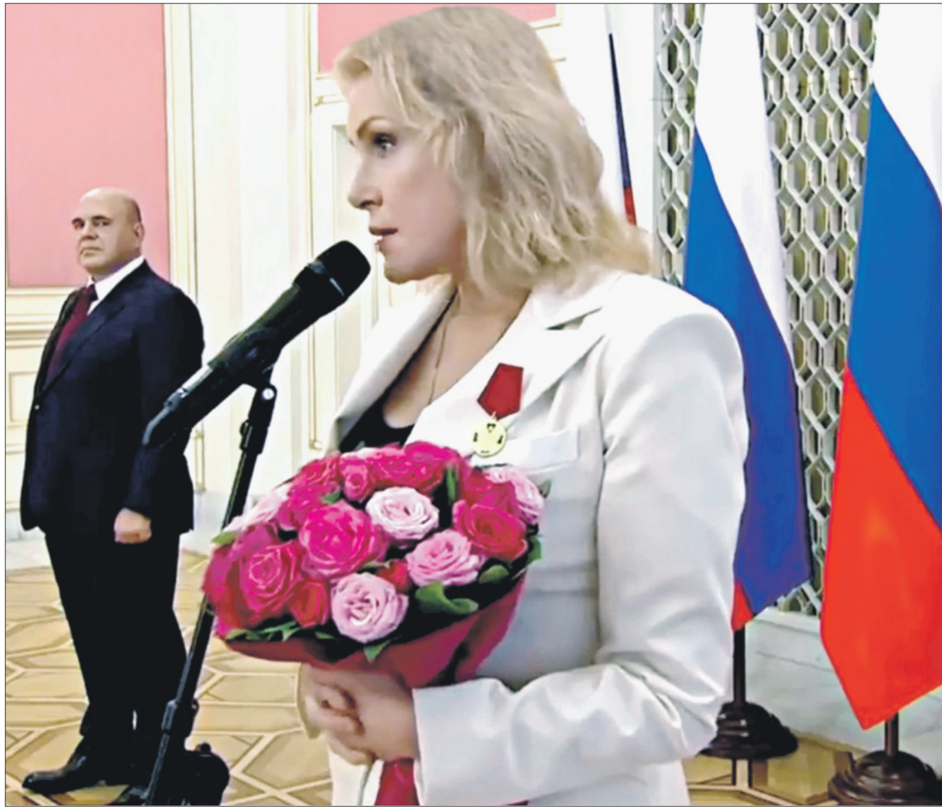
Мария ШУКШИНА :

Мария Шукшина во время получения в Кремле ордена «За заслуги перед Отечеством» 1-й степени неожиданно сказала то, что наболело уже у многих граждан. Премьер-министр Мишустин почему-то сразу сжал руки в кулаки.