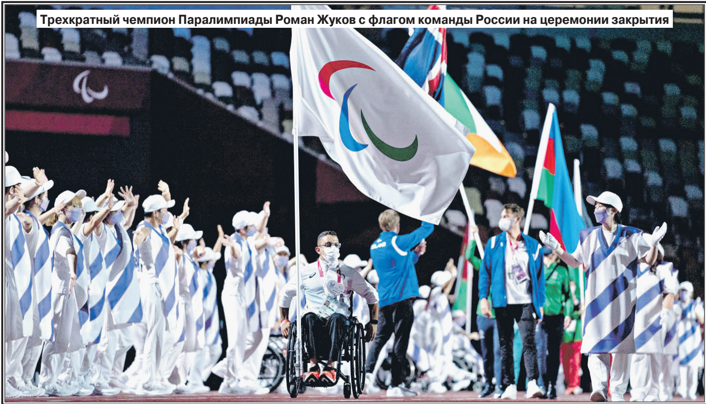
Трехкратный чемпион Паралимпиады Роман Жуков с флагом команды России на церемонии закрытия