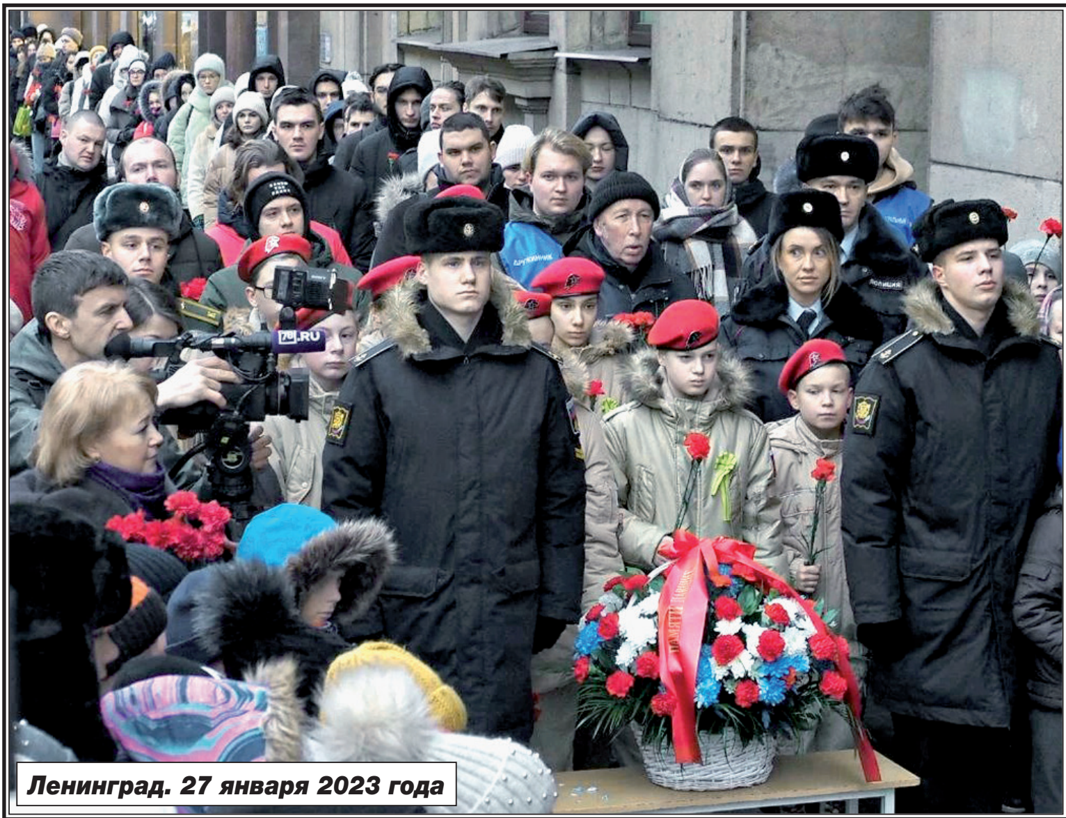
Ленинград. 27 января 2023 года