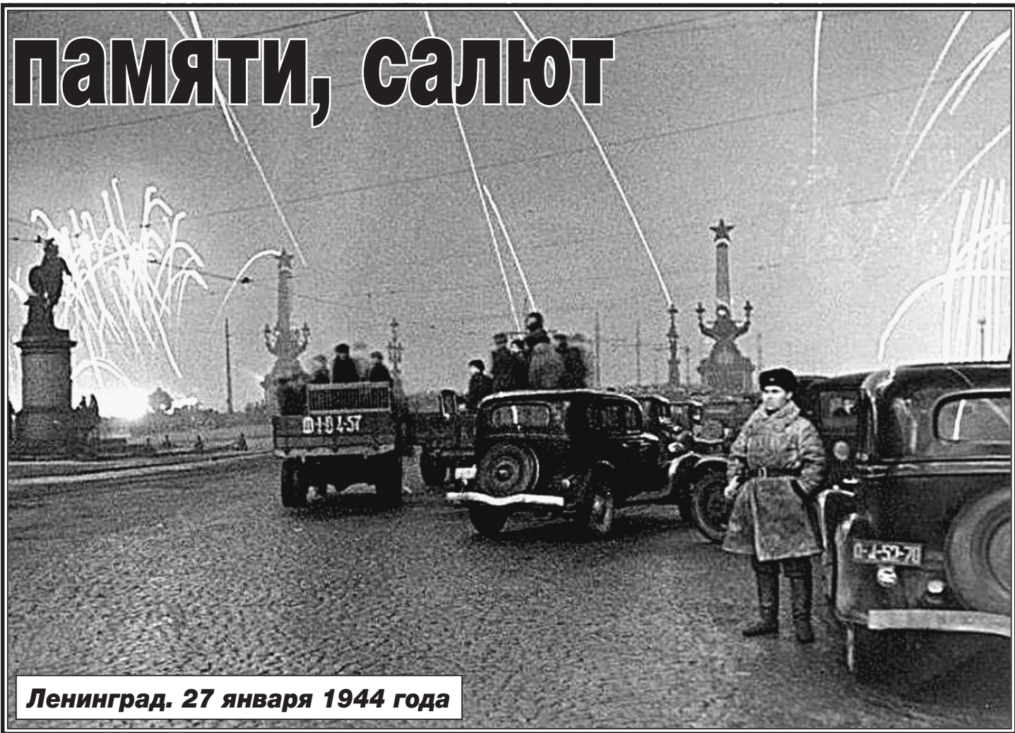
Ленинград. 27 января 1944 года