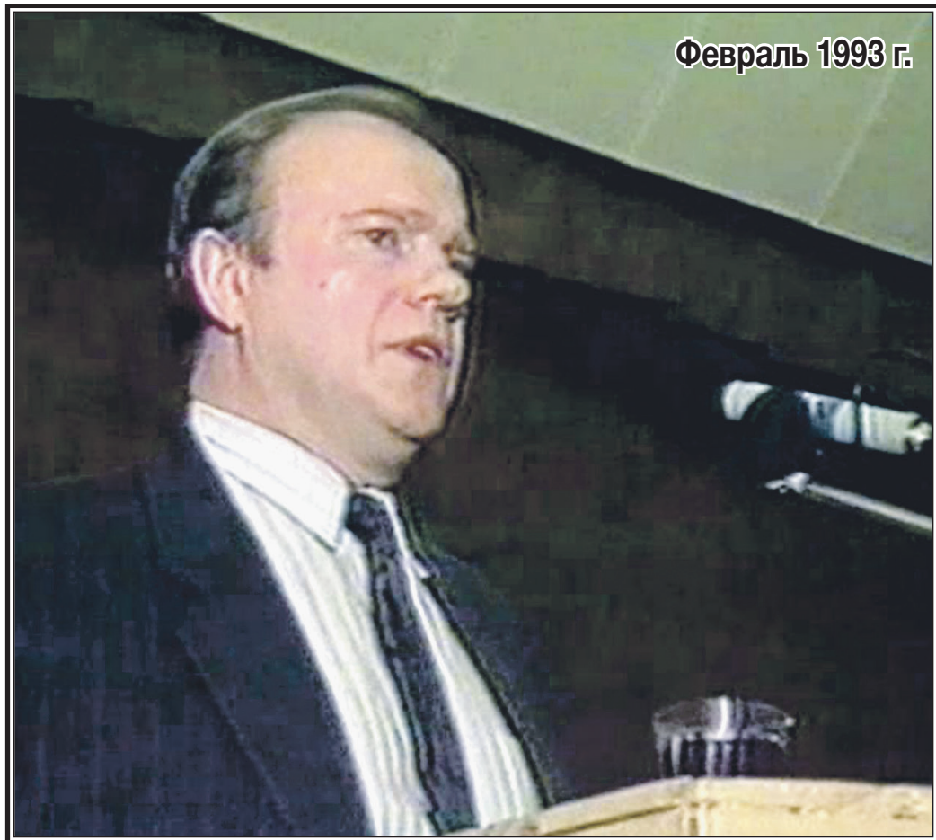
Февраль 1993 г.