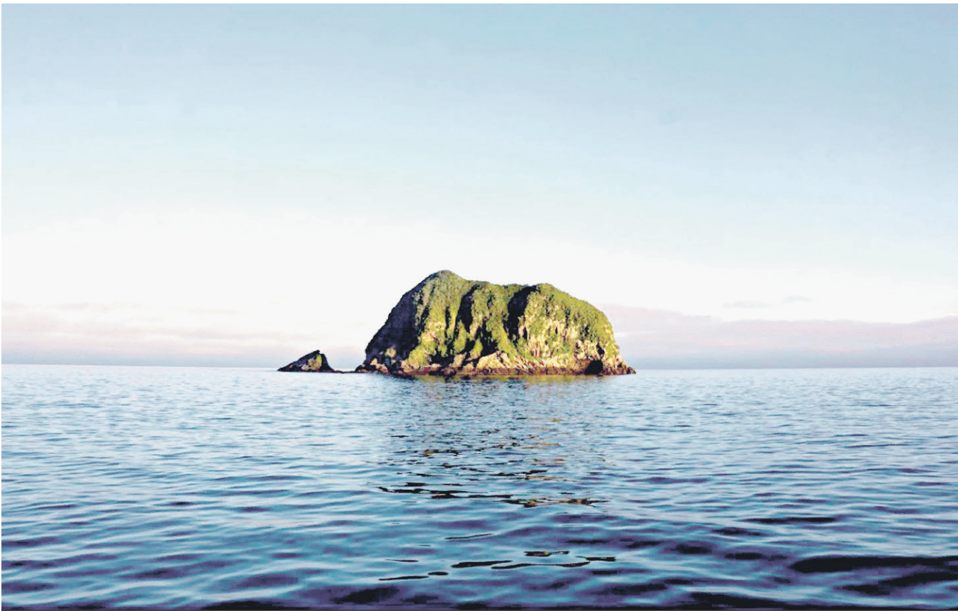
Остров Рогачева. Здесь располагается одна из крупнейших на Южных Курильских островах колоний тушика-носорога, которая насчитывает от 17 до 30 тысяч пар

Маленький остров Рогачева славится одним из крупнейших птичьих базаров Южных Курил – здесь гнездятся десятки тысяч морских птиц. Однако статуса особо охраняемой природной территории (ООПТ) он так и не получил. В 1983 году, когда создавался федеральный заказник «Малые Курилы» (находится под управлением заповедника «Курильский»), остров не был включен в его состав.