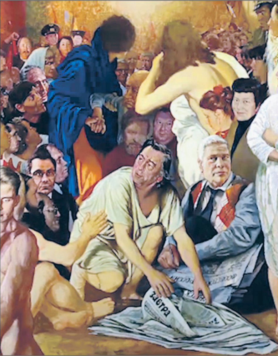
Редакторы на баррикадах. Фрагмент картины Сергея Бочарова «Явление народу»