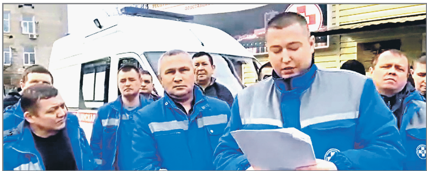
Видеосюжет полностью смотрите на сайте sovross.ru

СК проведет проверку по жалобе водителей из Чувашии.