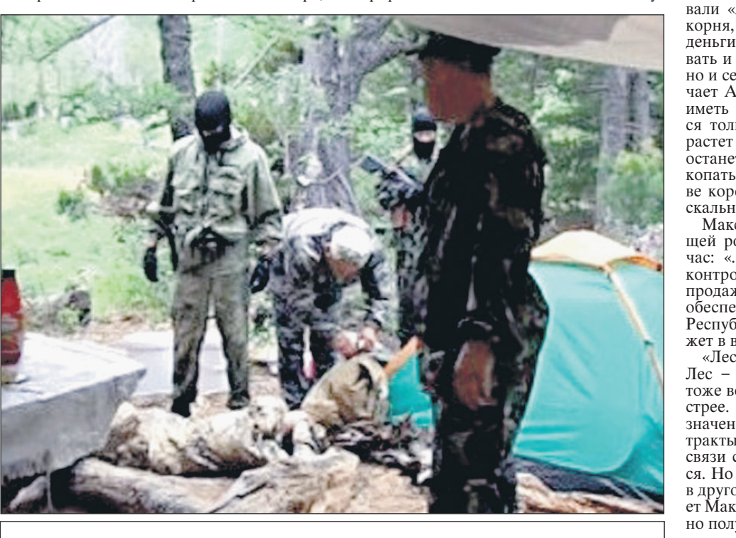
Задержание «черных копателей» родиолы

Сезон сбора золотого корня начинается в мае, когда с горных вершин сходит снег, и продолжается до середины октября,