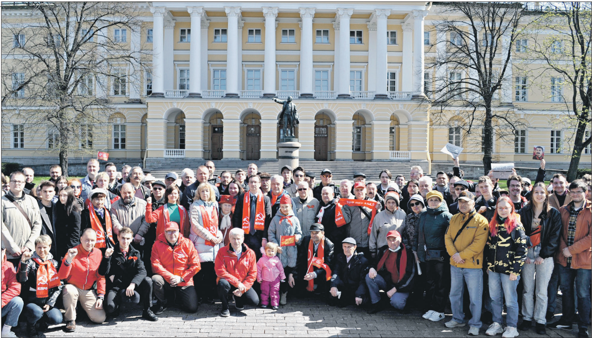
Маявка-23. У порога Смольного

– Французский пролетариат вышел на защиту своих конституционных прав против повышения пенсионного возраста. Российские капиталисты и чиновники делают все возможное, чтобы утопить любой протест. При этом лицемерно прикрываются патристическими лозунгами, красивыми словами о единстве общества. Но какое может быть единство, если простые люди вынуждены экономить на еде, чтобы заплатить за квартиру, а олигархи продолжают набивать кошельки, придумливая при поддержке властей все новые способы ограбления граждан? Поэтому мы вновь заявляем о своем решительном несогласии с такой политикой.