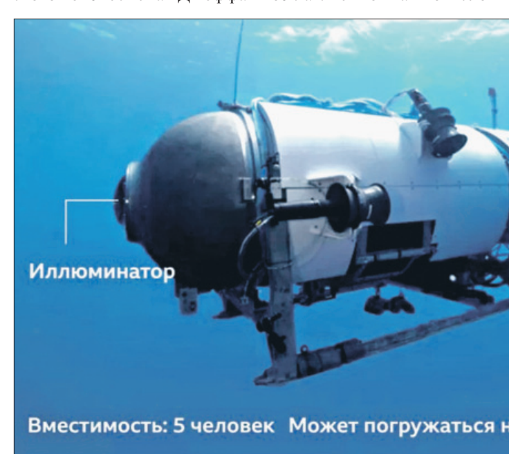
Иллюминатор Вместимость: 5 человек Может погружаться на 4000 м

Добрался ли батискаф до дна в принципе, неясно.