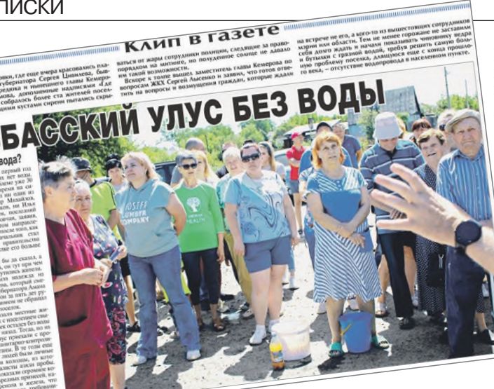
КУЗБАССКИЙ УЛУС БЕЗ ВОДЫ

15.06.2023 г. «СР» рассказала, как жители Кузбасского посёлка объединились, чтобы заставить власть построить водопровод. И вот тему продолжила «Говорит НеМосква». Перед вами живая драма трудового посёлка. Посёлок Улус (официально Улус-Мозжуха) последние 26 лет входит в состав города Кемерово – областного центра Кузбасса, главного угледобывающего региона России (60% добычи и половина экспорта). Из центра Кемерово без пробок можно доехать до Улуса за 15 минут. Но близость к городу ничего не значит для посёлка, где никогда не было водопровода.