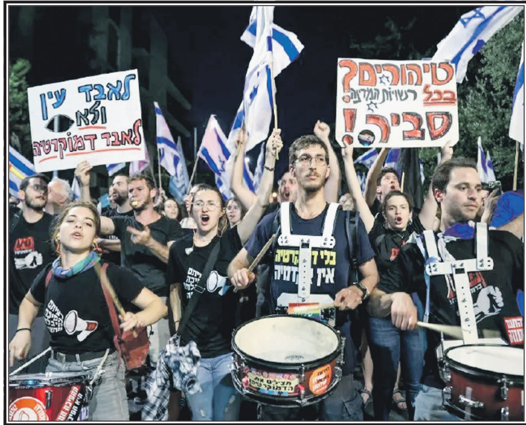
Спецоперация на Украине

Израиль. Масштабная акция протеста Народ восстал против реформы