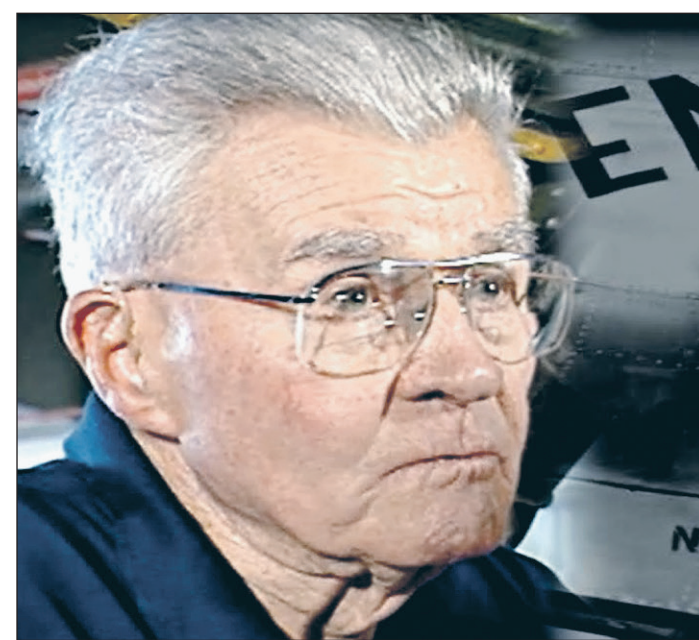
Тени погибших ему не снились