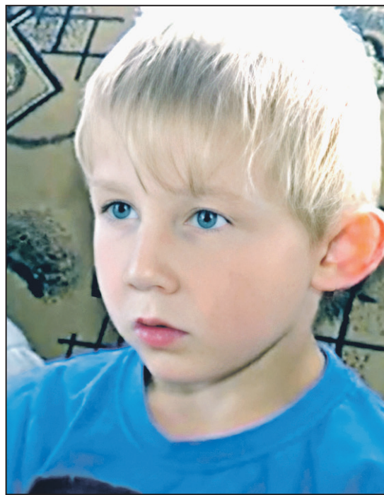
Видеолип смотрите на нашем сайте sovross.ru

«Газпром» пропиарили, а ребячьи выплаты отобрали