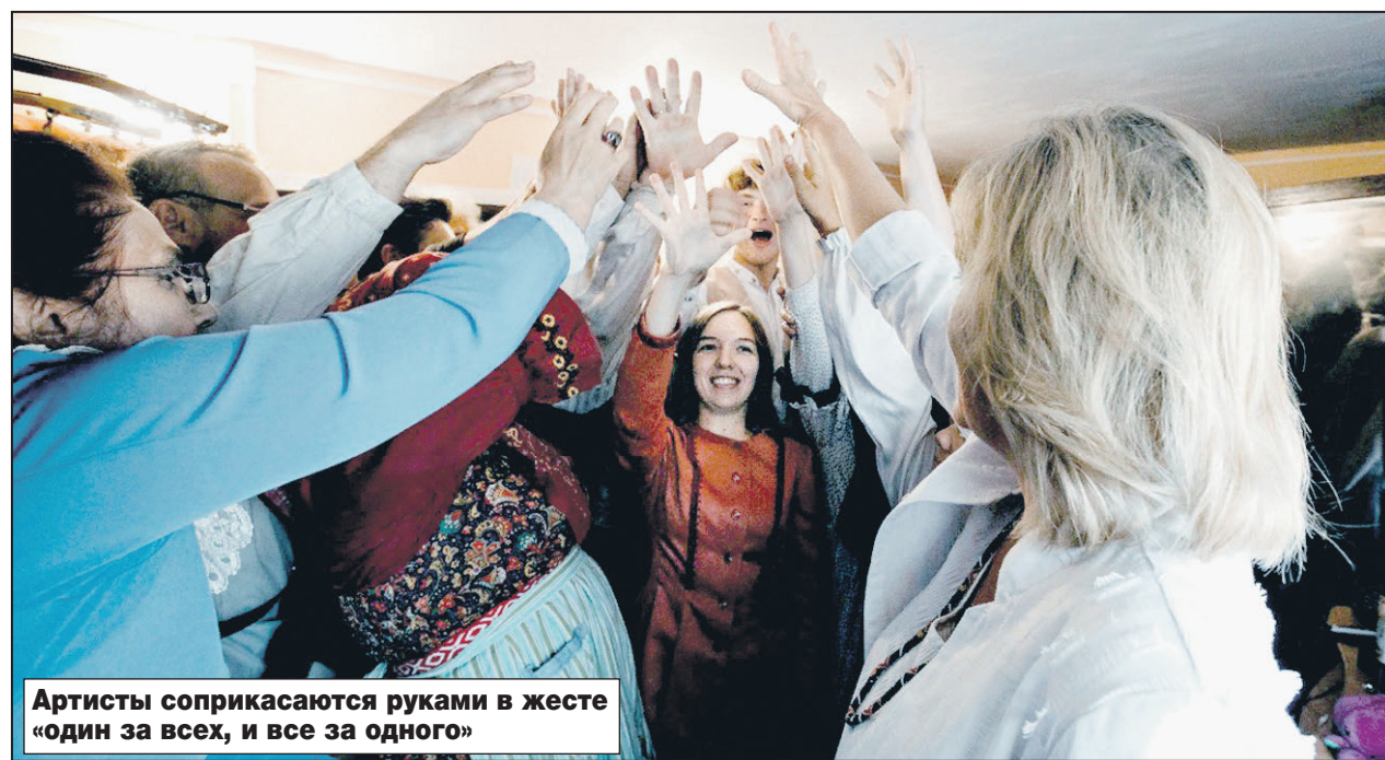
Артисты соприкасаются руками в жесте «один за всех, и все за одного»