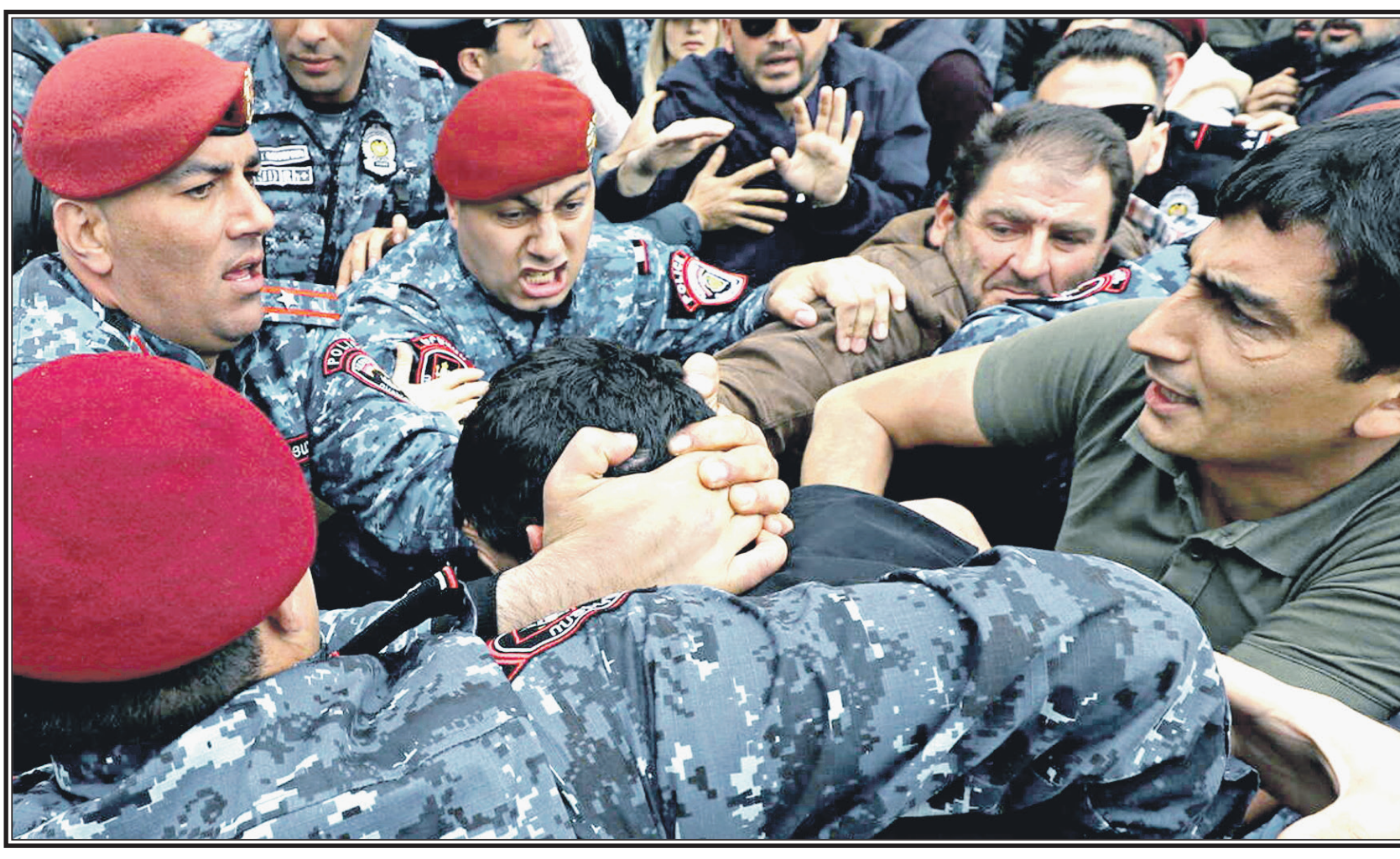
Джим ШУТТО CNN (США)

Последние оценки заметно отличаются от первоначальных сообщений о контрастном наступлении, в которых было намного больше оптимизма. Украин-