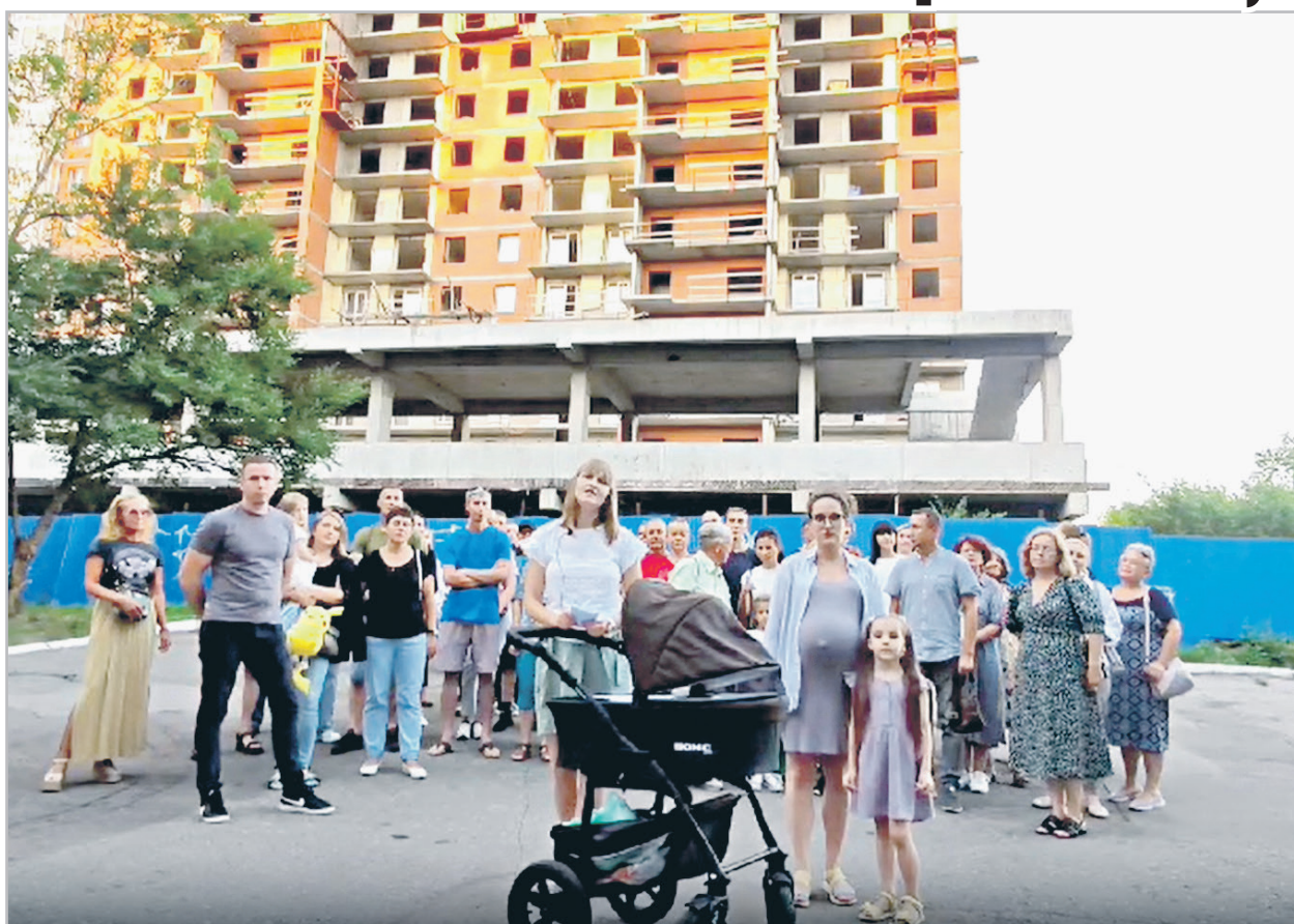
Видеолип смотрите на нашем сайте sovross.ru

Обманутые дольщики хабаровского ЖК «Ленинградский» уже не в первый раз обращаются к федеральной власти. «Строительство нашего дома начато в 2016 году и не завершено до нынешнего времени. Все что мы можем получить в результате так называемого восстановления нарушенных прав участников долевого строительства — это компенсация. Но размеры компенсации являются несправедливо заниженными, что не позволит нам приобрести иное жилье. Мы исчерпали все возможности, позволяющие построить наш дом, и требуем вашего вмешательства. Нам нужны наши квартиры», — рассказали дольщики. Горожане отметили, что им приходится снимать квартиры и платить ипотеку за несуществующее жилье. Многие продали старые квартиры, чтобы купить новые, но остались ни с чем. По их словам, чиновники не спешат помочь дольщикам, сколько бы жалоб те ни отправляли. «...сейчас непонятно, сколько еще ждать и доживу ли я до этого», — сетует пожилой хабаровчанин. Более 400 семей оказались обмануты застройщиком ООО «Лидер». Срок сдачи сначала перенесли на сентябрь 2020 года, потом на сентябрь 2021-го. В январе 2021 года стройка была остановлена. В конце апреля 2023 года обманутые дольщики выехали на митинг, где подписали резолюцию, которую отправили Михаилу Мишустину.