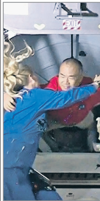
Астронавты и космонавты на борту Международной космической станции.