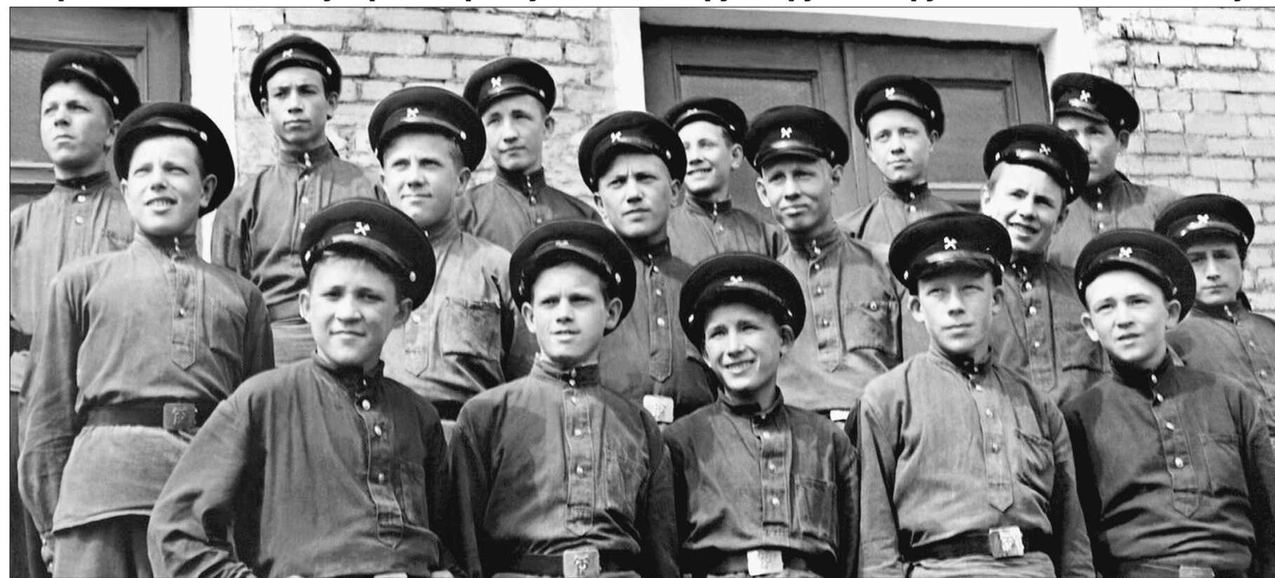
Ленинград. 1954 год. Строительное училище №2