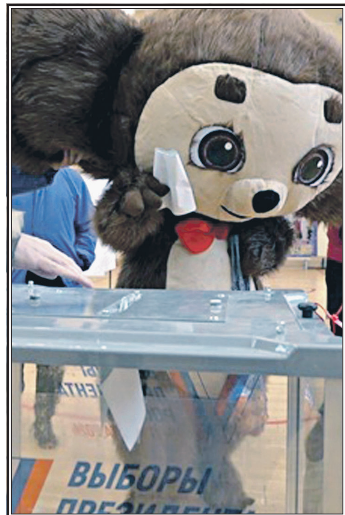
Чебурашка ищет себя в списках