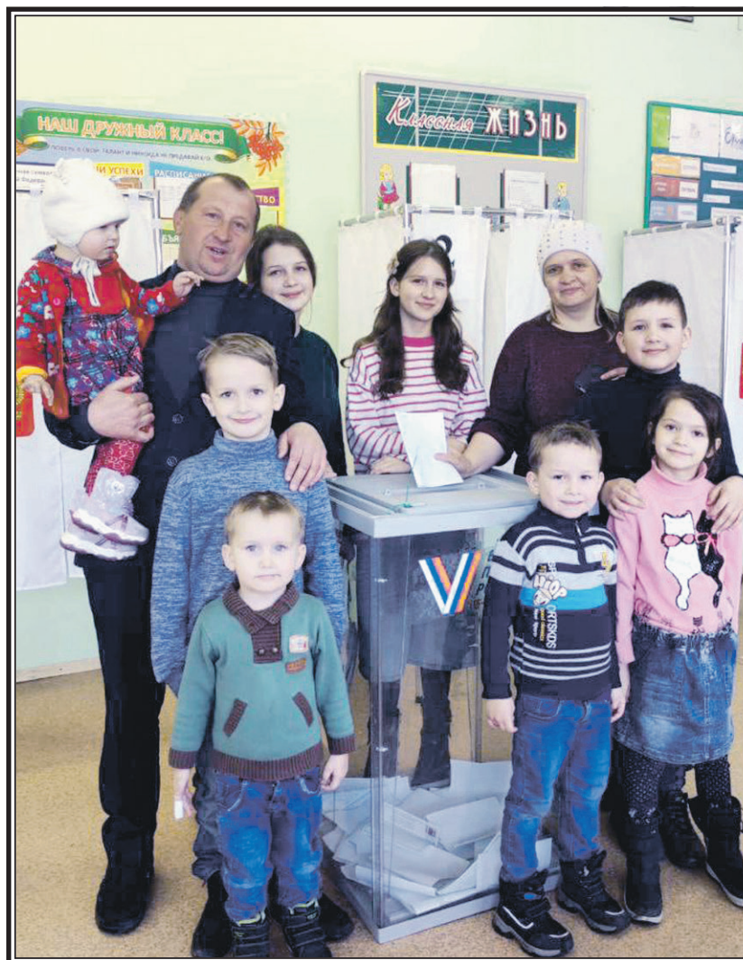
Многодетное участие в выборах