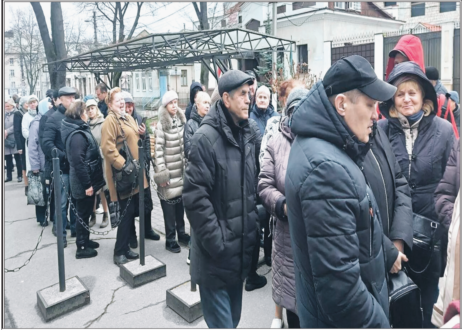
Наши соотечественники в Молдавии голосуют за Россию. Наммерие президента Санду организовать в октябре референдум по интеграции страны в ЕС их точно устроить не может.