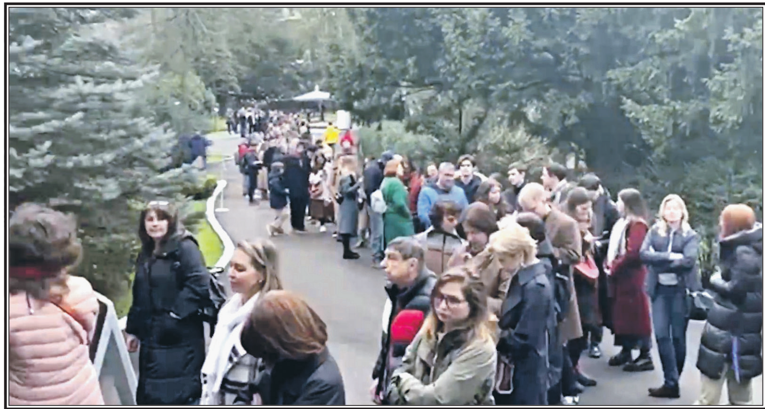
Голосование за Россию в столице НАТО Брюсселе

В крупнейших городах мира с 15 по 17 марта можно было видеть длинные очереди. В этих очередях стояли наши соотечественники, граждане России, по разным причинам оказавшиеся за рубежом.