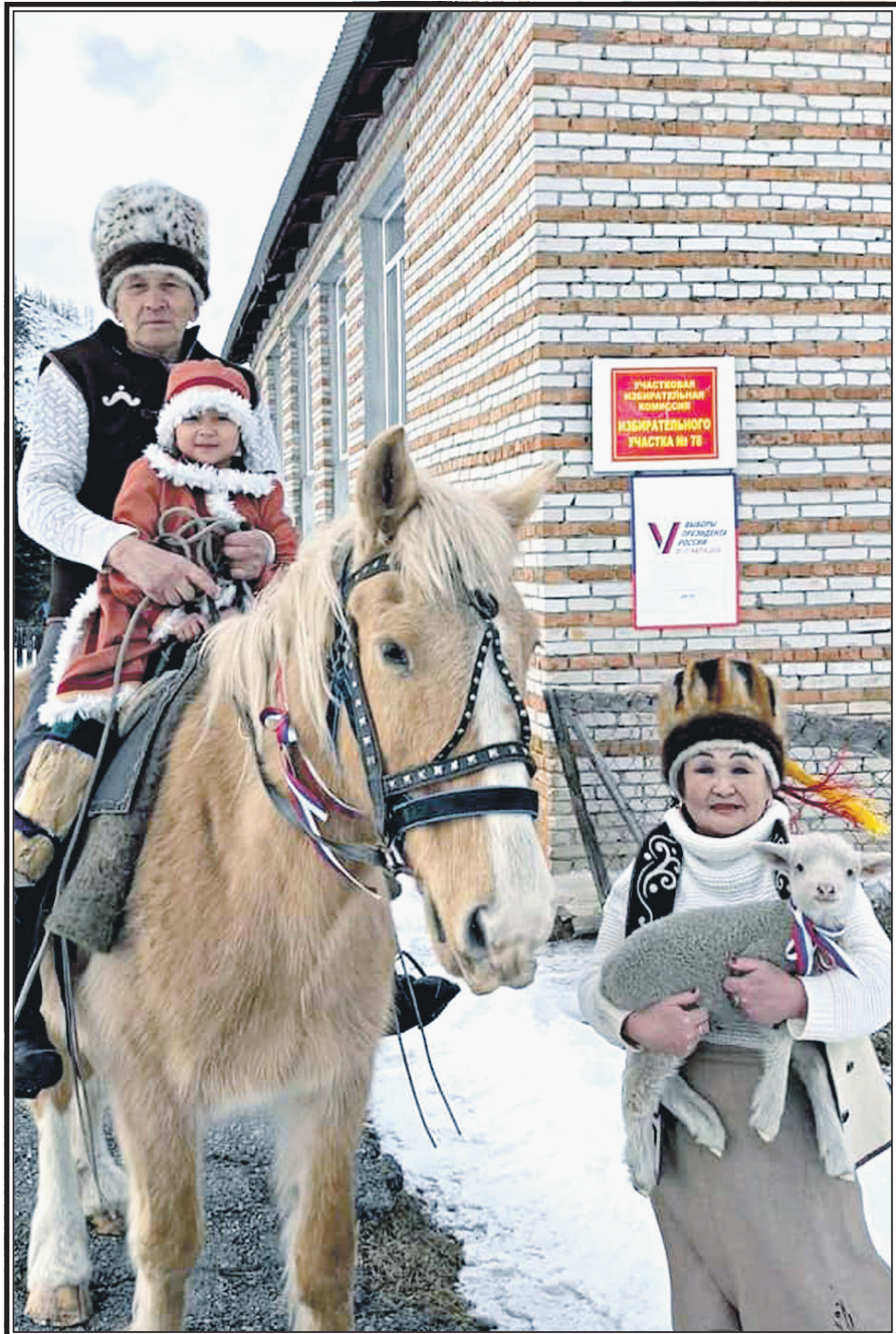
Голосовать всей семьей – на коне и с барашком

Как оказалось, наших «за бугром» очень и очень много. А значит, нас никогда не победить!