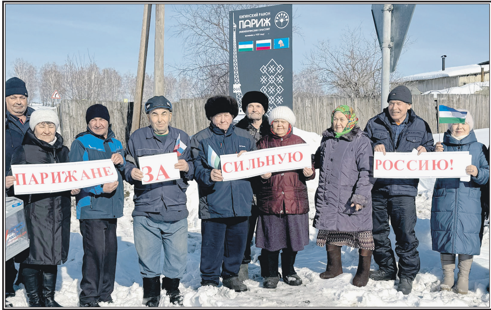
Парижане из башкирского Парижа