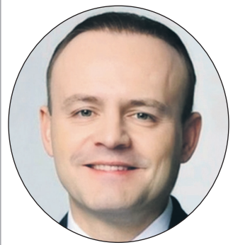
ДАВАНКОВ Владислав Андреевич