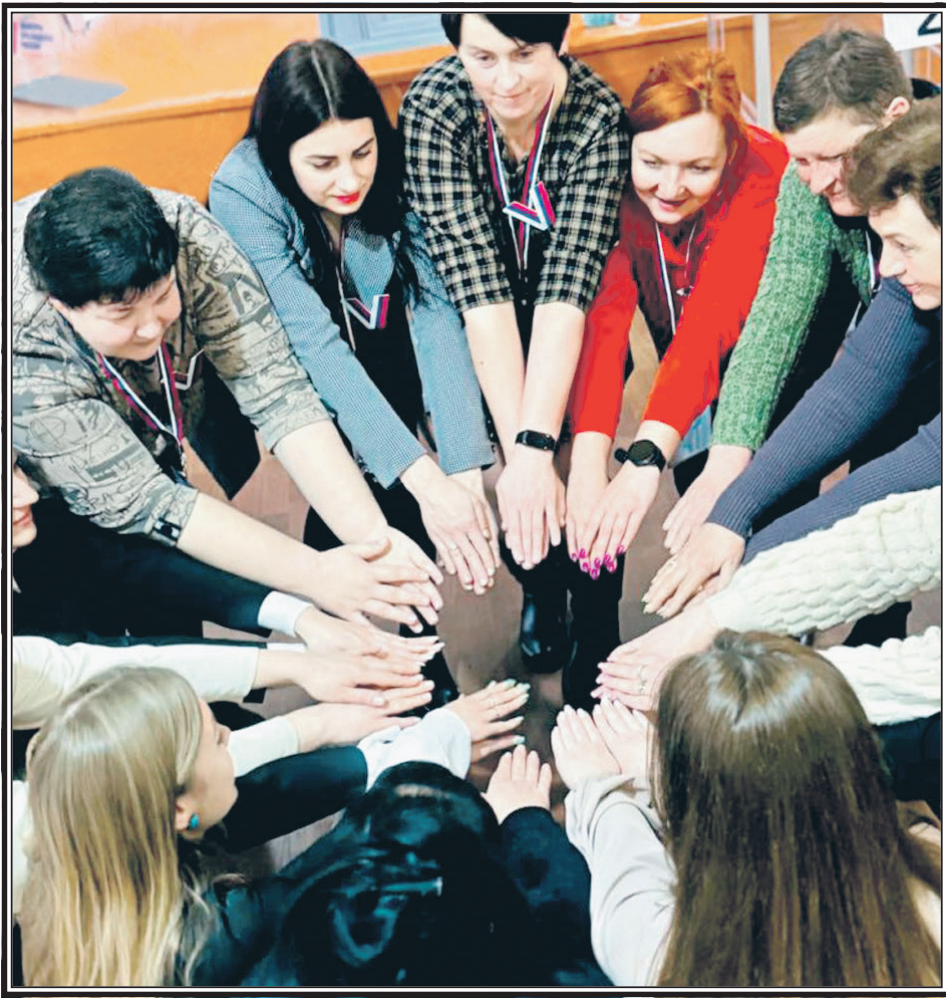
Кольцо луганской радости